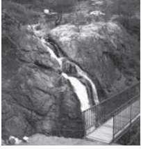
Şirketlerin yok etmek istedikleri Kaz Dağları...