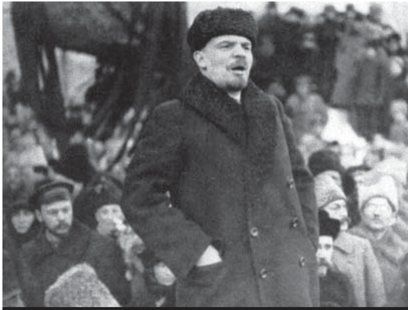
Kimileri stalinizmin Lenin'in düşüncesinin devam olduğunu ileri sürüyorlar. Bunlar Lenin'in ömrünün son döneminde bütünüyle bürokrasiye karşı mücadele ettiğini görmüyor ya da görmemezlikten geliyorlar.

Gerek Doğu Avrupa'da gerekse de 1991'den sonra dağılan SSCB'den ortaya çıkan yeni ülkelerde kısa zamanda görüldü ki yeni sermaye sınıfı eski bürokratları. Bir çok yerde eski yöneticilerin önemli bir kısmı yeni şapkalar takarak, yeni sermayedarlar olarak ortaya çıktılar. Bütün yeni milyarlar eski elit bürokrasinin ya kendisi ya da evlatlarıydı.