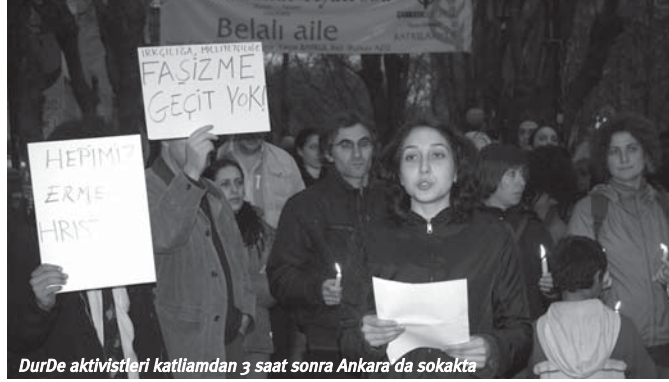
DurDe aktivistleri katliamdan 3 saat sonra Ankara'da sokakta