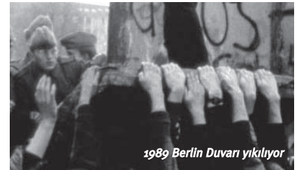
1989 Berlin Duvarı yıkılıyor

Enternasyonal Sosyalistler, yüzlerini yeni mücadeleciler kuşağına çevirdiler. Mücadele yükseldikçe, mücadeleciler kesimlerin öne çıkması ve devrimci geleneğin sürdürücüleriyle buluşması mümkün olacaktı.