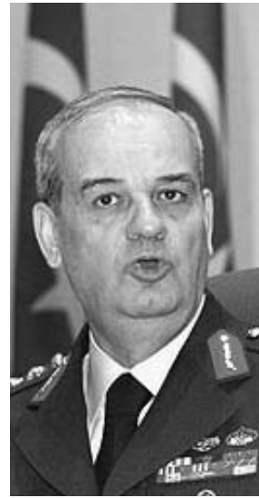
Dünyanın çoğu ülkesinde insanlar genelkurmay başkanlarının adını bilmez. Ama Türkiye'de yaşayan herkes genelkurmay başkanını yakından tanır

Suç duyurusunun üzerinden 24 saat geçmeden her biri ırkçılığa, milliyetçiliğe ve savaşa karşı olmasıyla tanınan muhalifler Türk İntikam Tugayı (TİT) tarafından ölümlü tehdit edildi. Baskın