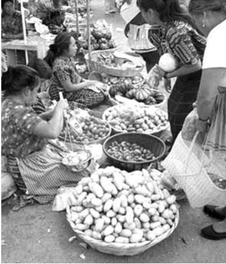
Dünyada her günkü üretim 6 milyar insanın ihtiyaçlarından fazlasını karşılayabilir. Ama 1 milyardan fazla insan kronik açlık çekiyor ve gıda fiyatları hızla yükseliyor.

Diğer taraftan piyasanın kendisi kuralsızlığı, dolayısı ile yılların mücadelesi ile kazanılan hakların gaspını dayatıyor. Bu koşullarda, içinde olabildiğince çok mal ve hizmetin piyasada satılmak üzere üretildiği; emek, toprak ve para piyasalarının da var olduğu kendi kendini düzenleyen bir sistem olarak piyasa ekonomisinin, adil ve iyi bir toplumla uyumlu olabileceğini söylemek hiç de gerçekçi değil. Ekonomik liberalizm ile