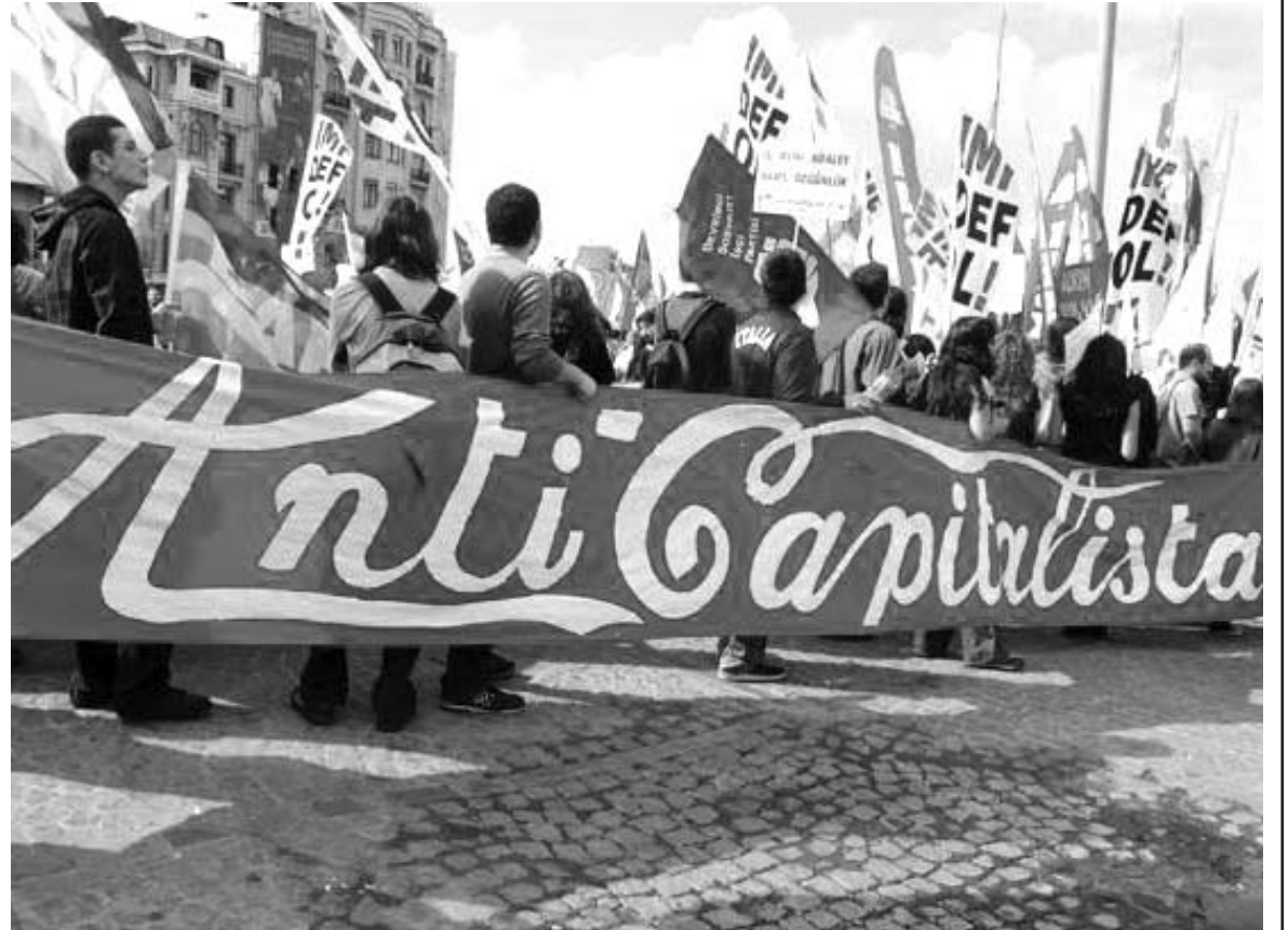
IMF toplantısında "adil bir dünya" üzerine süslü sözleri edilirken az ötede Taksim'de Antikapitalistler "iş, iklim, adalet, barış, özgürlük" sloganıyla adil bir dünyanın yolunu gösteriyordu

IMF Başkanı da, Dünya Bankası başkanı da, "yeni model" ve "yeni kalkınma" dan bahsetti. Dünya Bankası Başkanı, bu modelin temelini