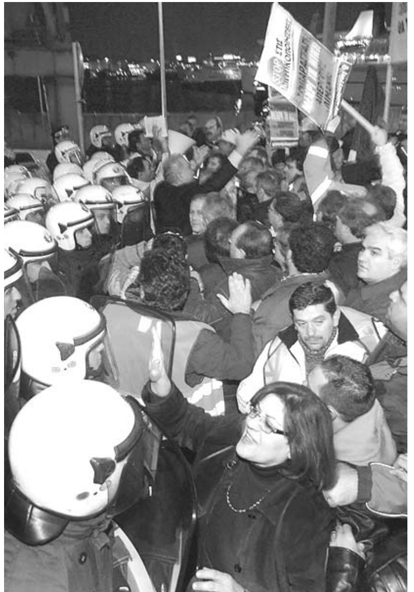
Karamanlis hükümetini zayıflatan temel güç grev ve genel grev yapan işçilerdi