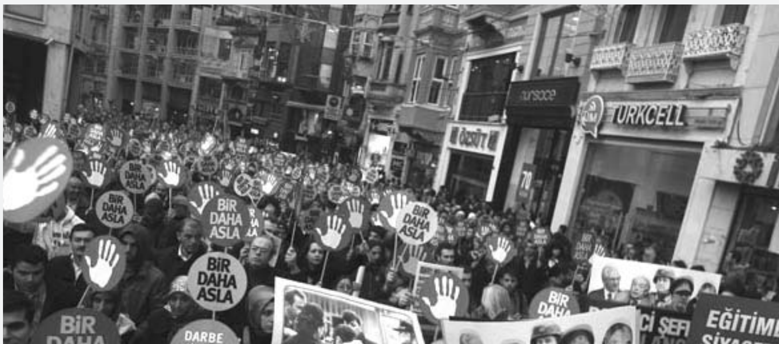
Darbeler dönemini halk kapatıyor. 28 Şubat darbesinin 13 yıldönümünde "erken final" diyen 20 bin darbe karşıtı "bir daha asla" dedi