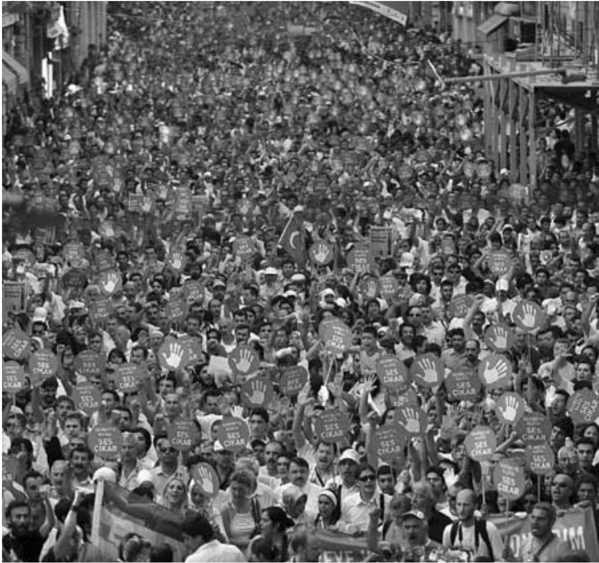
21 Haziran 2008, darbeye karşı ilk ses, İstiklal Caddesi'nde 10 bin kişi yürürken.

Bu yılın şubat ayının ortalarında, Cumhuriyet Başsavcısı İlhan Cihaner, İrtica ile Mücadele Eylem Planı'nın ilk uygulamasını