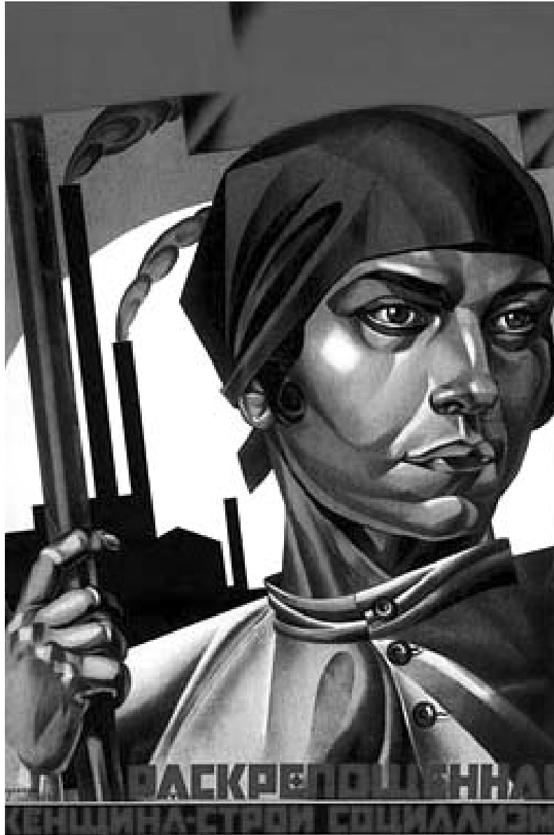
1917 Devrimi, 8 Mart'ta kadın işçilerin grevi ile başlamıştı. Devrimden sonra cinsel özgürlük politikaları hayata geçirildi.

Lezbiyenler için hayat daha zordu. Zengin kadınlar okuma