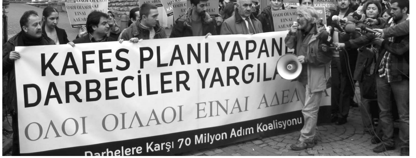
Yeni Sol parti girişimindeki kemalistler Darbelere Karşı 70 Milyon Adım koalisyonuna düşmanca yaklaştı.

Kitlesel bir sol partiyi, yeni bir sol partiyi örgütlemenin de tek yolu bu. Kestirme yollarla örgütlenmeye çalışılan sol parti süreci kaçınılmaz bir biçimde gruplar koalisyonu mantığıyla ve anti demokratik yöntemlerle örgütlenmek durumunda kalıyor. Son altı ayda yaşadığımız deneyim ne yapmalı sorusuna daha güçlü bir yanıt vermemizi de sağlamış oldu!