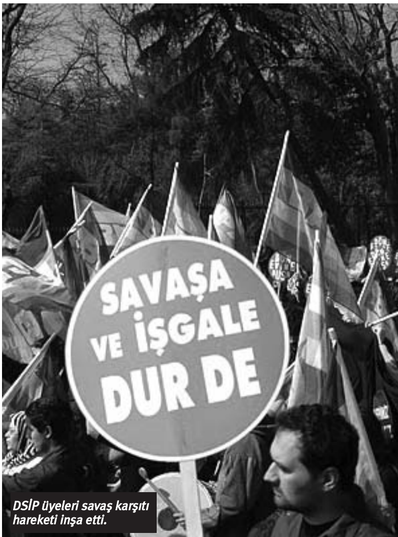
DSİP üyeleri savaş karşıtı hareketi inşa etti.