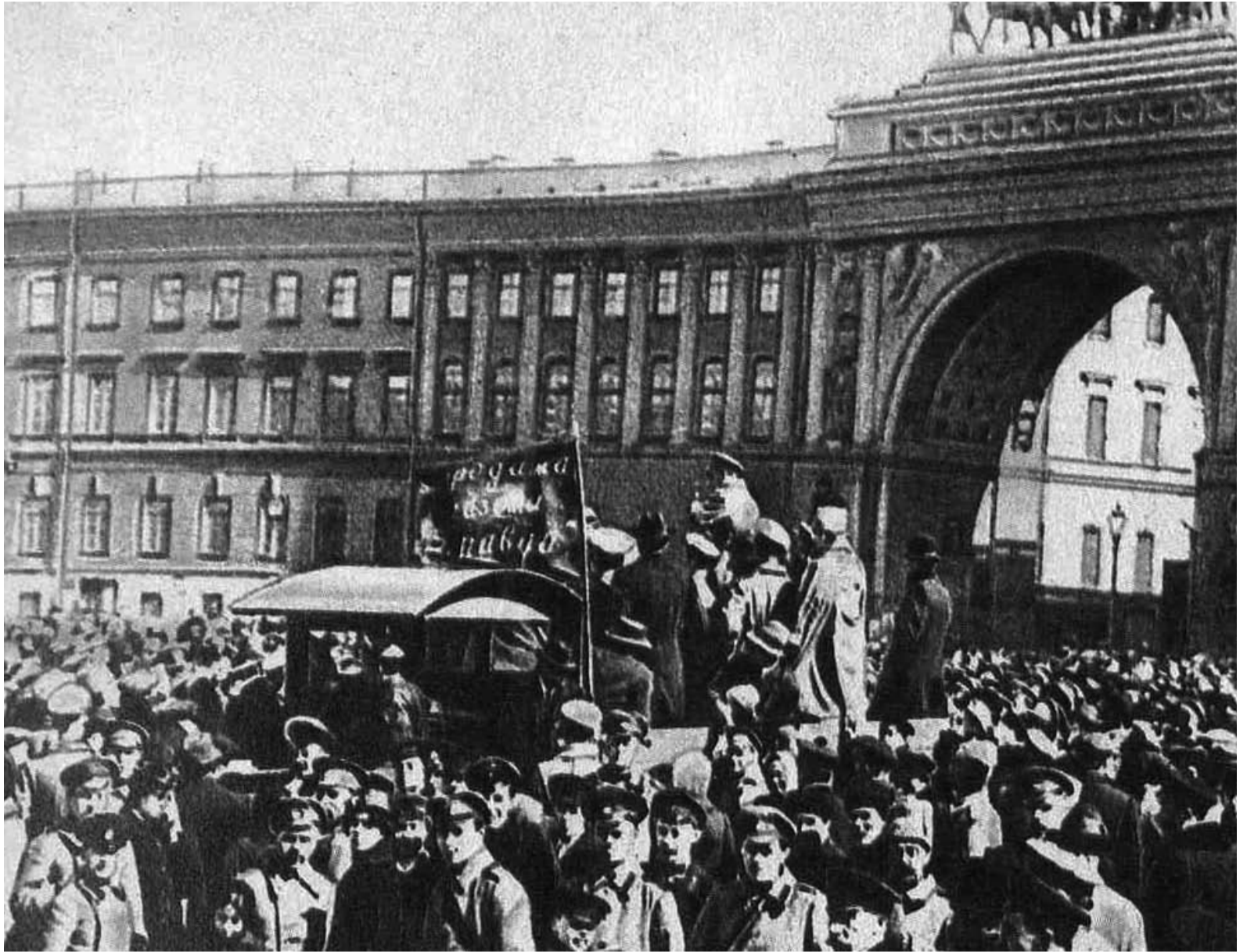
1917 Petrograd'da Bolşevikler işçilere ve askerlere sesleniyor.

"Tüm iktidar Sovyetlere" sloganı, 1917 Şubat devriminin hemen ertesinde, Nisan ayında Lenin'in Bolşevik Parti'nin üst düzey kadrolarındaki tutuculukla mücadele ettiği Nisan Tezleri'nin en önemli vurgusuydu. İşçi sınıfının burjuvaziyle iktidarı paylaşamayacağını, bunun imkansız olduğunu ve toplumdaki tüm köklü sorunların, toprak sorunu, ulusal sorun ve demokrasi ve barış sorunu gibi sorunların çözülmesi için işçi sınıfının iktidarı kendi ellerinde toparlaması gerektiğini ifade eden bir slogandı. Ama Lenin, Blanqi geleneğinden gelmediklerini, darbeci bir sosyalizm anlayışına sahip olmadıklarını her yeri geldiğinde söylüyordu. Eylül