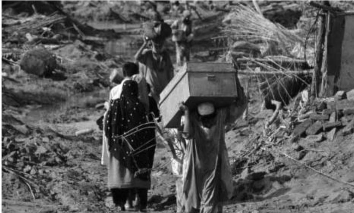
Yoksul ülke Pakistan’ı tarihinin en büyük iklim felaketi vurdu. 1100’den fazla insan öldü, yaşam felç oldu.

“İklim adaletsizliği gün geçtikçe artıyor. Ülkeler, iklim değişikliğinden kaynaklanan iklim mültecilerinin olacağını bildiği için şimdiden çıkardıkları yasalarla zaten sistem tarafından ezilenlerin iklim değişikliği sonucunda bir kez daha ezilmesini onları “suçlu” statüsüne koyarak pekiştirip kendini güvence altına almaya çalışıyor.”