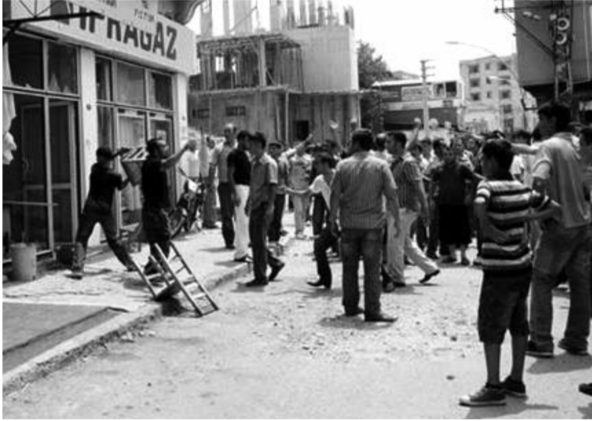
Dört Yol'da Kürtlere ait bir çok işyeri ve ev yakıldı. Linç girişimini kışkırtanın bir uzman çavuş olduğu mobese kameraları tarafından tespit edildi.

Hem İnegöl'deki hem de Dört Yol'daki saldırılara anlatıldığı gibi binlerce insan değil birkaç yüz ülkü ocakları üyesi katılıyor. İnegöl'deki saldırılar sırasında faşistlerin arasında kalan bir gazetecinin aktardığına göre saldırganlardan birisi telefonla konuşurken "Abi görev tamamdır. Araçlar ateşe veriliyor. Bozkurt işareti bile