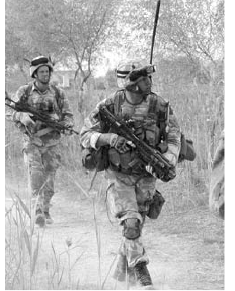
Yüzlerce sivilin NATO askerleri tarafından öldürüldüğü gibi işgalcilerin askeri başarısızlıklarını da ortaya çıktı.