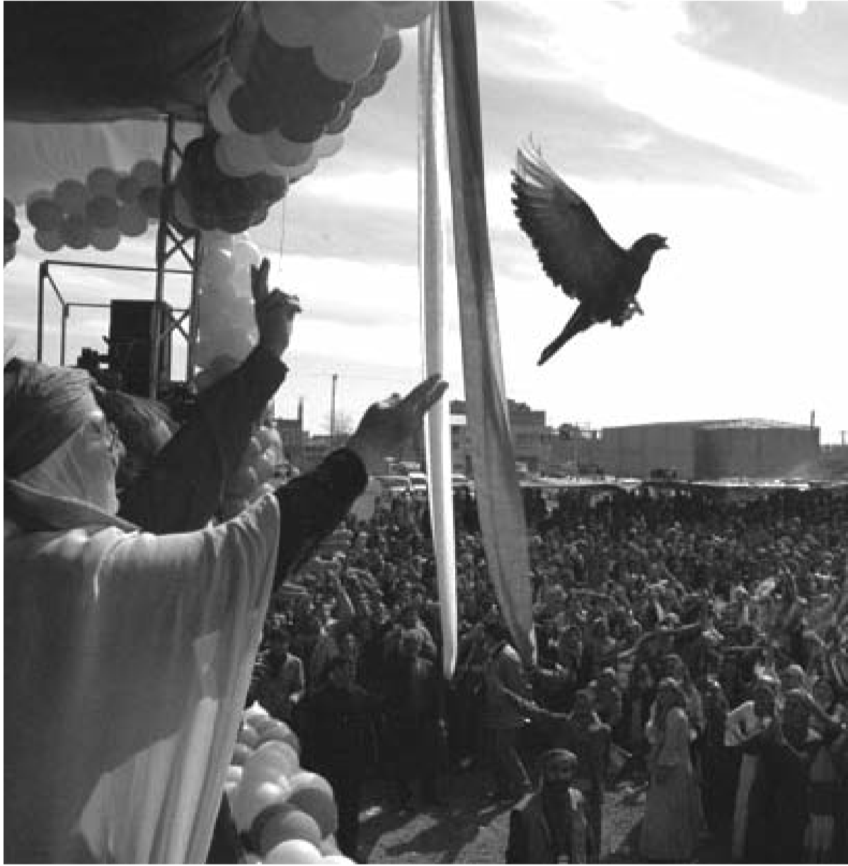
BDP, 29 Mart yerel seçimlerinde 2 milyon 300 bin insanın oyunu almıştı.

Sosyalistler, kapitalist toplumda halkların aynı ulusal devletler içerisinde yaşamalarını ancak "gönüllü birliklik" kapsamında onaylayabilirler. Bunun anlamı şudur: ezilen ulus, kendisini sınırları içerisinde tutan bir devletin içinde yer almaya devam edip etmeyeceğine kendisi karar verir. Bu konuyla ilgili ezilen ulusun siyasi hareketine