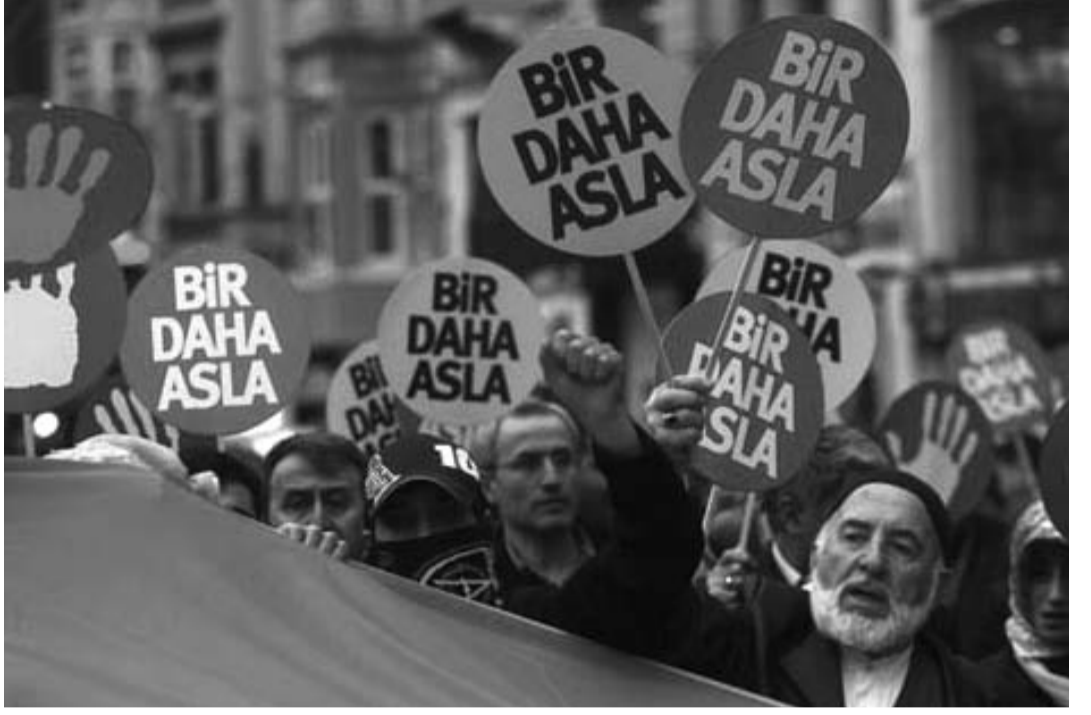
Sosyalistler değişim ve insanca bir yaşam isteyen, daha fazla demokrasi ve özgürlük isteyen milyonlardan uzak duramaz, onlara düşman olamaz.

Solun bir kesimi ise her seferinde olduğu gibi alttan alta CHP yandaşlığı yapar, bir başka kesimi her zaman olduğu gibi en keskin ama en gereksiz sloganlarla kendisine oy isterken, yani sek-