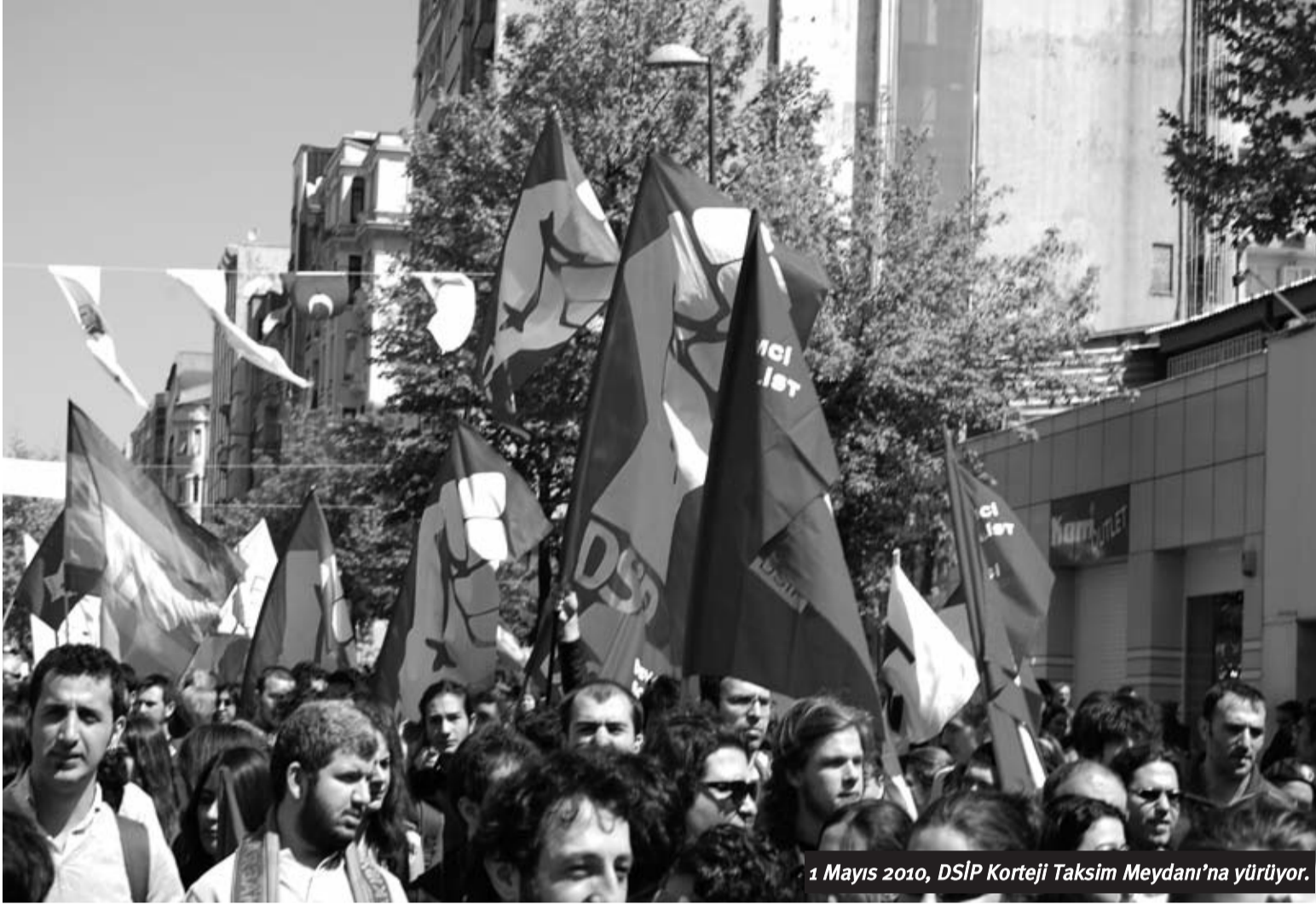
1 Mayıs 2010, DSİP Korteji Taksim Meydanı'na yürüyor.

“DSİP’i geri kalan soldan ayıran asıl fark 1989’da yıkılan stalinist rejimlere bakıştır. Bizim için iyi, kötü sosyalizm olamaz. 1989’da Doğu Avrupa’da, 1991’de ise SSCB’de yıkılan rejimlerin sosyalizm ile bir ilişkisi yoktu. Bunlar devlet kapitalisti rejimlerdi.