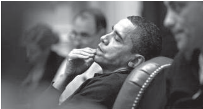
Daha iki yıl dolmadan Obama, Amerikan halkı için bir hayalkırıklığına dönüştü.

Obama döneminde ekonomi pek de iyi gitmedi. İşsizlik oranı artıyor. O göreve geldiğinde siyahlar arasında işsizlik %11'di, bugün %16. Eksik istihdam oranı %18'i geçti. ABD'lilerin evlerine haciz geliyor. Obama