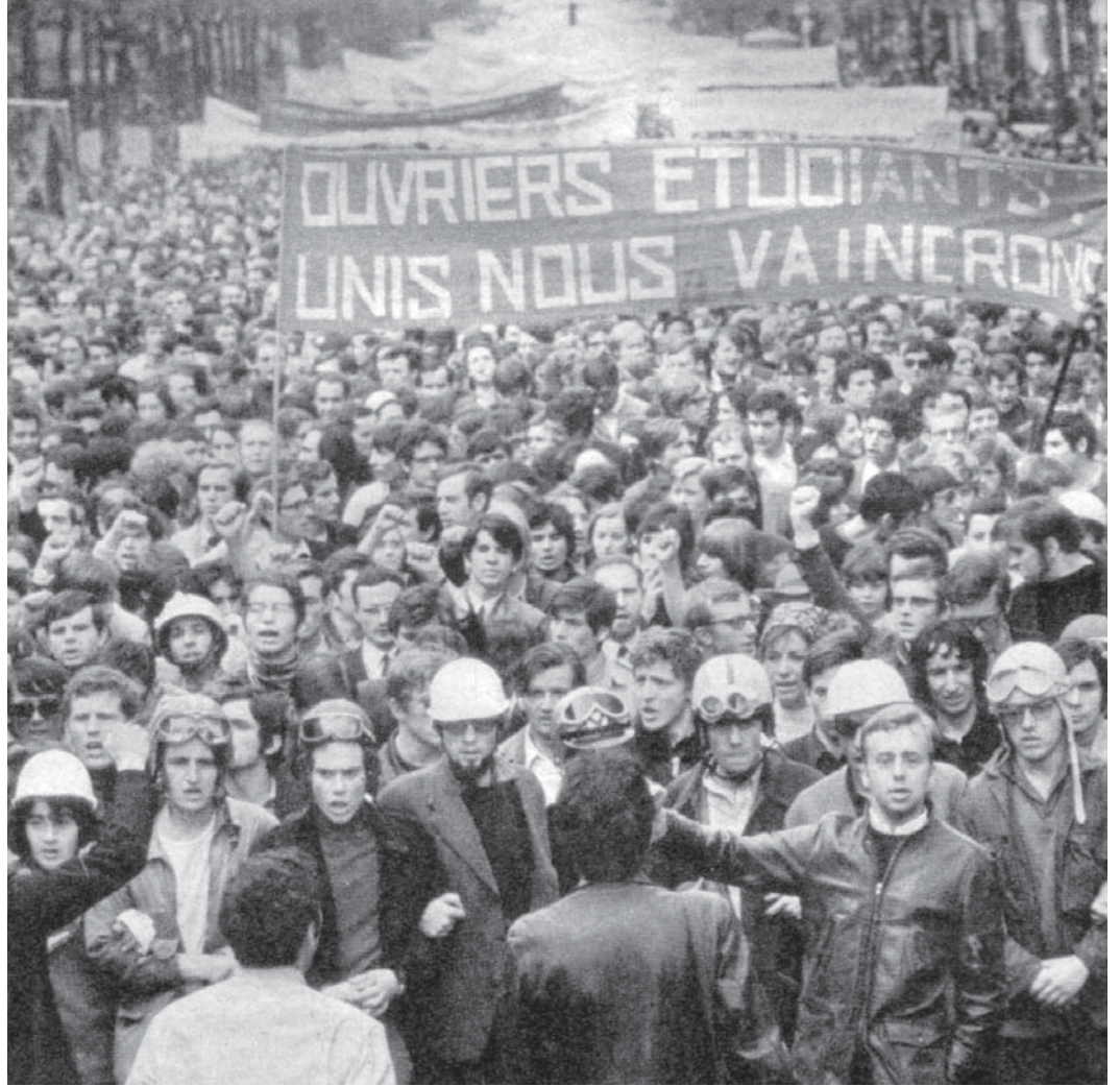
1968 Mayıs'ında Fransa'da 10 milyon işçi greve çıktı, devlet başkanı Almanya'ya sığınırken harekete önderlik edecek devrimci parti yoktu.

Yönetenler bizim güçsüz olduğumuzu düşünmemizi istiyor çünkü onlar gücümüzden korkuyorlar.