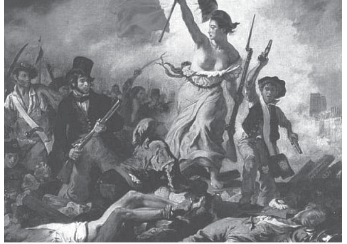
1789 Devrimi'nden sonra burjuvazi "eşitlik-özgürlük-adalet" taleplerini yerine getirmekten, liberalizm ve marksizm iki ayrı siyasal akım olarak ortaya çıktı.