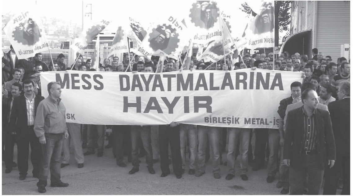
Metal işkolunda ücretler bu yıl yüzde 24, yani dörtte bir oranında düştü. İşverenler sendikası MESS'in her dediği oluyor.

■ Reel ücretlerde en ciddi gerileme yüzde 35 ile Programcılık ve Yayıncılık sektöründe yaşanırken, bu sektörü büro yönetimi ve büro destek işleri yüzde 28'lik oranla takip etti.