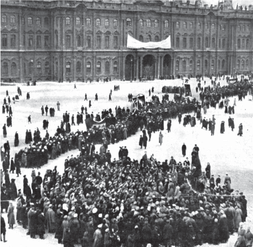
1917 yılında Rusya'da bir devrimle iktidara gelen işçiler, kapitalizmin yenilebileceğini, devletin yenilebileceğini kanıtladı.

yapılan bir askeri darbeye yardım etti. Ancak işçiler gücü bu azınlıktan alabilecek potansiyele sahiptir. 1917'de dünyadaki egemen sınıflar, Rusya'daki karşı devrimcilerle birlikte Rus Devrimi'ni ezmeyi denedi. Karşıdevrimci general Kornilov şöyle diyordu: "Toprakların yarısını yakıp yıkmamız ve tüm Rusların dörtte üçünün kanını dökmemiz gerekse bile Rusya'yı kurtarmalıyız." Başarısız oldular. Devleti geri püskürtecek bir devrim için işçi sınıfının çoğunluğunu devrimi desteklemesini sağlamak ve egemen sınıfın değişimi direnmesine karşı koymak için güç kullanmaya hazır olmak gerekir. Bu illaki muazzam ölçüde şiddet kullanılmasını gerektirmez, güçlü hareketler kazanmak için daha az fiziksel güce gereksinim duyarlar. Güçlü bir hareket egemen sınıfın fikirlerinin etkisini krabilir, ekonomideki kontrolünü