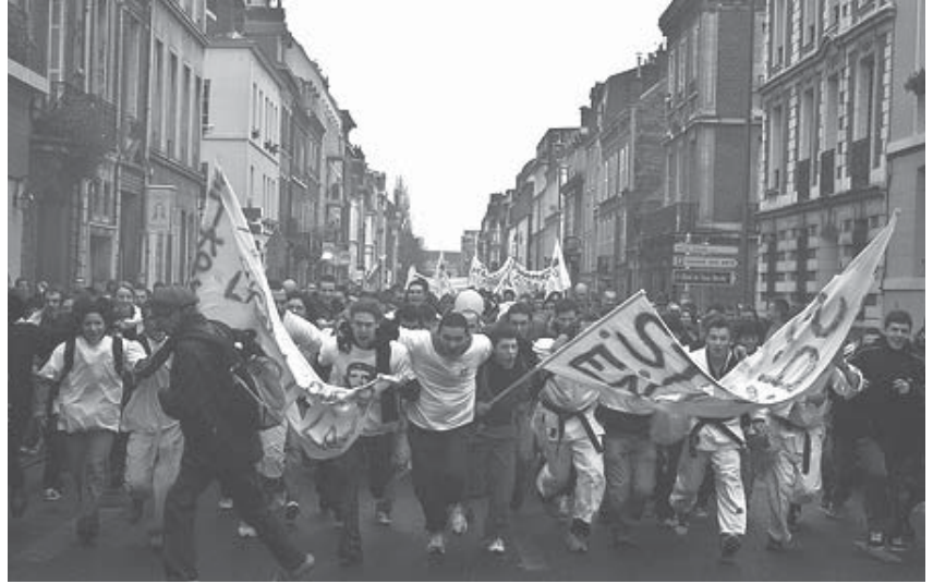
Fransız işçi sınıfı 2010 yılında 7 kez genel grev yaptı, bu illerdeki mücadelelerin de habercisi..

CGT Genel Sekreteri Thibault eylemliliğe devam ederek reformun uygulamaya koyulacağı Temmuz 2011'e kadar pazarlık şansının yakalanabileceğini düşünse bile grevin şimdilik kabul edilen en büyük etkisi Sarkozy siyasetine verdiği zarar