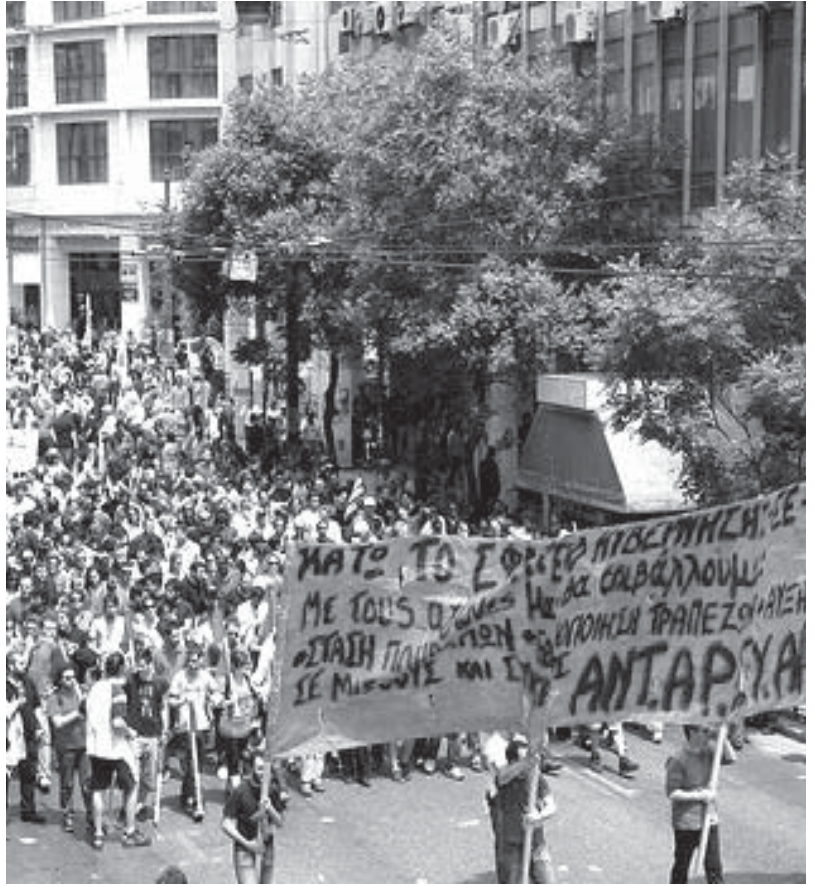
Devrim için Antikapitalist Sol Koordinasyon (ANTARSYA) oylarını dörde katlayarak toplam 100.000 oy aldı