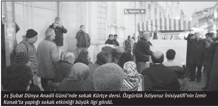
21 Şubat Dünya Anadil Günü'nde sokak Kürtçe dersi. Özgürlük İstiyoruz İnisiyatifi'nin İzmir Konak'ta yaptığı sokak etkinliği büyük ilgi gördü.

Sokakta, ırkçılığı, yeni liberal politikaları, demokratik ve yepyeni bir anayasanın gerekliliğini, sınırsız özgürlükleri, Kürt halkıyla birlikte savunacağımız, Ermeni soykırımına karşı birlikte ses çıkartacağımız bir seçim kampanyası, hepimizi, seçimlerden sonraki yeni mücadele dönemine hazırlayacaktır.