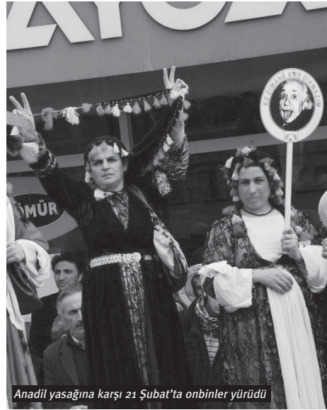
Anadil yasağına karşı 21 Şubat'ta onbinler yürüdü

■ Yüzde 10 seçim barajı kaldırılmalı: Seçim barajının adil olmadığını, darbeciler tarafından rejime muhalefet eden partileri engelle-