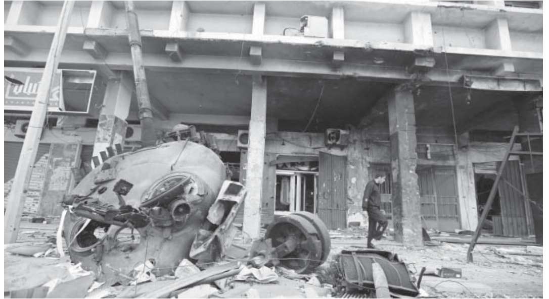
Libya'da halk Kaddafi zulmünü yaşamaya devam ederken, NATO bombardımanı yaşamı çekilmez hale getirdi.

Faşist bakanların da yer aldığı aşırı sağcı hükümet, işgal altındaki topraklarda yeni yerleşim birimleri kurmaya devam ediyor. 1967'de altı gün süren İsrail-Arap savaşında Siyonist devlet, Batı Şeria ve Doğu Kudüs'ü Ürdün'den, Golan Tepeleri'ni Suriye'den ve Gazze şeridini Mısır'dan zorla almıştı. El Fetih ve Hamas, 1967 sınırları öncesine dönülmesini isterken aslında Filistin topraklarının sadece yüzde 22'sinde özgürce yaşama hakkı istiyor. İsrail ise buna yanaşmıyor. Bu koşullar, devrimci dalganın alt üst ettiği Ortadoğu'da, 3. İntifada'yı hazırlıyor.