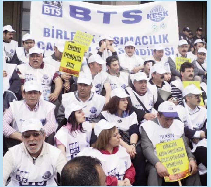
16 Mayıs 2011 - BTS üyeleri TCDD Genel Müdürlüğü önünde oturma eyleminde.

Türkiye, seçim sonrasında da bazılarının sandığını tersine, dünyanın bir parçası olmaya devam edecek.