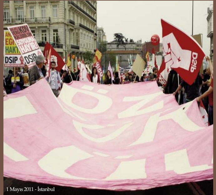
1 Mayıs 2011 - İstanbul

Biz sosyalistler tüm ezilenler için özgürlük istiyoruz. Yasaksız, gerçek bir demokrasi, halk için işleyen adalet, sınırsız düşünce, örgütlenme ve eylem özgürlüğü istiyoruz. Tüm çalışanlara grev hakkı tanınmasını, sendika düşmanlığını son verilmesini talep ediyoruz. Ergenekon soruşturmalarının yolundan saptırılmamasını, katillerin ve darbecilerin hak ettikleri cezalara çarptırılmalarını istiyoruz. 12 Haziran'dan sonra özgürlük mücadelesi gündeme gelecek. Özgürlük olmadan, demokrasi