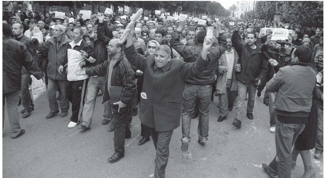
Ortadoğu ve Kuzey Afrika'da devrimci dalgayı diktatör Bin Ali'yi deviren Tunus Devrimi başlattı. Tunuslular ekmeğin ayaklanırken...