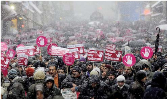
24 Ocak 2010, yılın en soğuk günlerinden biri. Balyoz darbe planının açığa çıkmasının ardından Darbelere Karşı 70 Milyon Adım Koalisyonu'nun eylem çağrısıyla binler İstanbul'da sokağa döküldü.