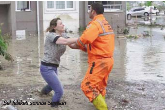
Sel felaketi sonrası Samsun

■ DSİP ve Küresel Eylem Grubu (KEG) 2005'ten bu yana küresel ısınmaya karşı mücadele ediyor. Sen de katıl!