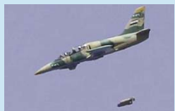
Suriye savaş uçakları, halkı 14 aydır bombalıyor.

Askeri harcamaların milli gelire oranı, diğer sosyal harcamalarla kıyaslanması, askeri güçlerin ve ağır silahların tüm topluma oranı üzerinden hesaplanan Küresel Militarizasyon Endeksi'ne göre Suriye dünyada 3. sırada. Rusya, Çin, İran ve Kuzey Kore rejime silah sağlıyor. Baas ordusunun 5 bin tankı, bine yakın savaş uçağı var. Özgür Suriye Ordusu ise ordudan kopan asker ve subayların el koydukları silahların yanı sıra rejimin görevlilerine rüşvet vererek silah elde ediyor. ABD ve İngiltere "radikal islamcı" grupların eline geçeceği gerekçesiyle muhalefete silah vermiyor. Bazı batılı güçler ise isyancıları silah vermeye savunuyor. Katar, Suudi Arabistan ve Türkiye gibi bölgesel güçlerin muhalefet içindeki bazı gruplara kısıtlı sayıda silah verdiği tahmin ediliyor.