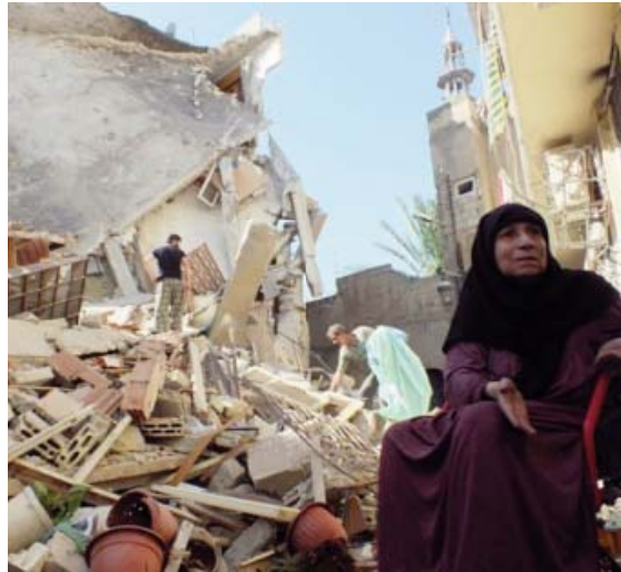
Suriye savaş uçakları yaşlı kadını evini yerle bir etti.

Rejimin uyguladığı yoğun şiddet sebebiyle mücadelenin büyük ölçüde askeri olarak devam etmesi, toplumun büyük bölümünün destekçisi olduğu politik mücadele sürecinin gelişkinliğinin bir ölçüde