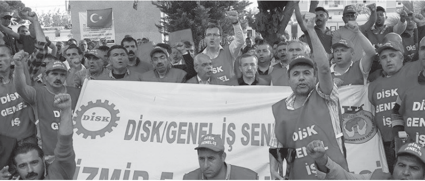
Taşeron sistemine karşı öfke mücadeleye dönüyor.