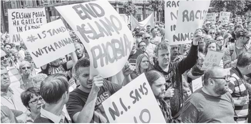
Geçen hafta İrlanda'nın Belfast şehrinde Avrupa'da yükselen ırkçılık protesto edildi.

Birçok yerde ise anaakım partiler büyük miktarlarda oy kaybetti, radikal sağ ve sol alternatifler öne çıktı. İngiltere'de yüz yılı aşkın bir süre sonra ilk kez, bir seçimi ne iktidar partisi ne de ana muhalefet kazanabildi. Avrupa egemenleri arasında kriz sonrası neoliberalizm konusundaki konsensüs korusa da, toplumların geniş çoğunluğu için bu politikaların yıkıcı etkisi siyaseti çarpıcı bir biçimde etkiliyor. Kıtanın çeşitli yerlerindeki işçi eylemliliğinin ve sokaklardaki kitle hareketlerinin yanı sıra, seçimlerde de düzen karşıtı söylemlere yönelim artıyor.