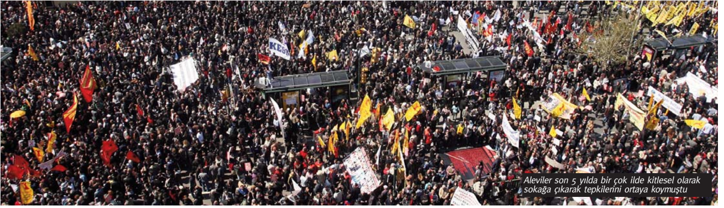
Aleviler son 5 yılda bir çok ilde kitlesel olarak sokaka çıkarak tepkilerini ortaya koymuştu