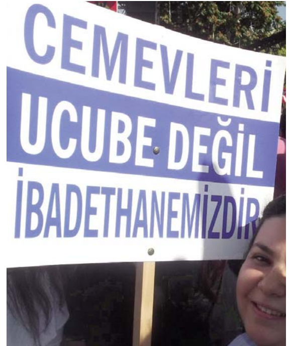
Hükümet, Cemevleri'ni ibadethane olarak kabul etmeyen tutumuyla mezhepçiliği körükliyor.