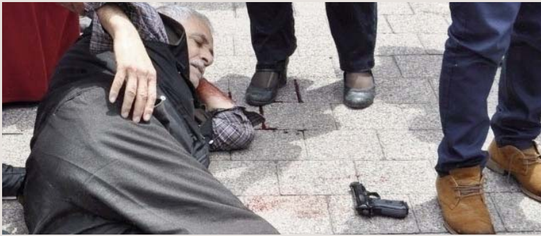
Önce Kadıköy, sonra Gaziosmanpaşa. İstanbul Valisi ve Emniyet, ülkücü terörünü görmezlikten geliyor.

MHP faşist bir partidir! Çözüm sürecine, barışa, diyaloga karşıdır! Savaştan yana olduğunu her fırsatta dile getirmektedir. Gaziosmanpaşa'daki saldıran faşistlerin çözüm sürecine duydukları öfkenin bir yansımasıdır. Barış süreci geliştikçe, MHP'nin de üzerinde yükseldiği ırkçı-milliyetçi ideolojik çimento dağılıyor. Bu nedenle, faşist hareketin gerilemesi için barış sürecinin gelişmesi, çözüm yönündeki adımların hızlanması ve hükümete açık bir barış yönünde adımlar atması için basınç yapılması çok önemli.