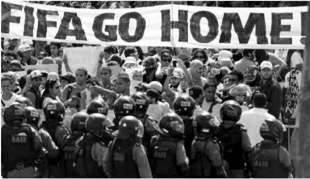
Dünya kupası organizasyonu için harcanan kaynaklara yoksullar öfkeli.

şüm öncelikle, yoksul işçi mahallelerindeki ailelerin mahallelerinden kovulması anlamına geliyor. Polislerin uzun süren grevinden sonra şimdi de metro işçileri süresiz greve girdi. Hükümet grevleri sona erdirmek istiyor. Her fırsatta vatandaşlarının anayasal hakkını koruyacaklarını açıklarken, diğer yandan "güvenliğe yönelik" önlemler adına orduyu görevlendiriyor. Brezilya'da sular durulacak gibi değil, tarihi eşitsizlik ve baskıyla şekillenmiş bir ülkede mücadele giderek büyüyor, protestocular 'bu daha başlangıç' sloganını dillendirerek bu eşitsizliğe karşı direniyor. Dünya Kupası boyunca sık sık gösterilere tanık olacağız.