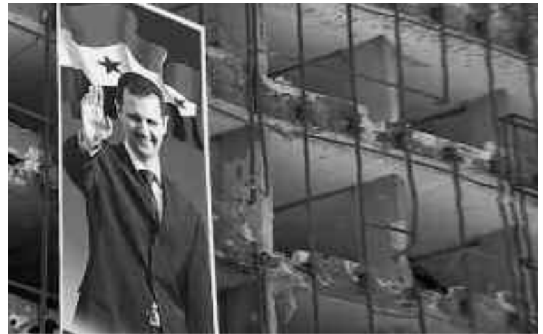
Esad'ın yıktığı binalarda Esad'ın seçim afişi

Putin sitili "icabına bakılan demokraside" seçim sonuçları önceden sabitleniyor. Türkiye'deki garip "sol" için antiemperyalist Esad'ın "icabına bakılan demokrasiyle" başa gelmesi bir emperyalist oyunu bozma olarak değerlendirilip kabul edilebilir belki ama biz komünistler için kapitalizmin kendisini ağırlıklı olarak Çin ya da Rusya sitili bir yönetim biçimiyle sürdürmeye çalışması olasılığı üzerinde düşünmeye