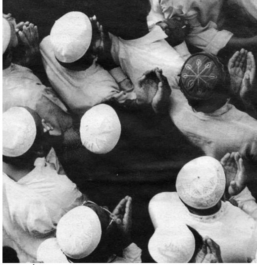
BOP: İslam coğrafyasında uygulanmak üzere, sözde fundamentalist İslam'a karşı, Ortadoğu halklarını hedef alıyor.

Diğer bir engel, Bush yönetiminin, baba Bush'tan yadigar ilişkileri. Özellikle Suudi oligarşisi ve bölgedeki -Saddam