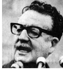
1990'da görevi bırakan diktatör Pinochet (sağda) 1973 yılında askeri bar darbeyle Şili'nin demokratik yollarla seçilen başkanı Salvador Allende'yi (solda) devirmiştir.

gizli servis mensubuna da 10 ila 15 yıl arasında hapis cezası vardı. Böylece 30 yıl sonra da olsa darbecilerin ve işkencecilerin önünde sonunda yargılanıp cezalandırılacağı kanıtlanmış oldu. Şili'de insan hakları örgütleri ve sivil toplum kuruluşları bu uğurda aralıksız mücadele veriyorlar. Şimdi ilk kazanımlarını elde ettiler. Böylece bize de üzerinden 24 yıl geçen 12 Eylül darbecilerini nasıl yargılayacağımız konusunda ilham verdiler.