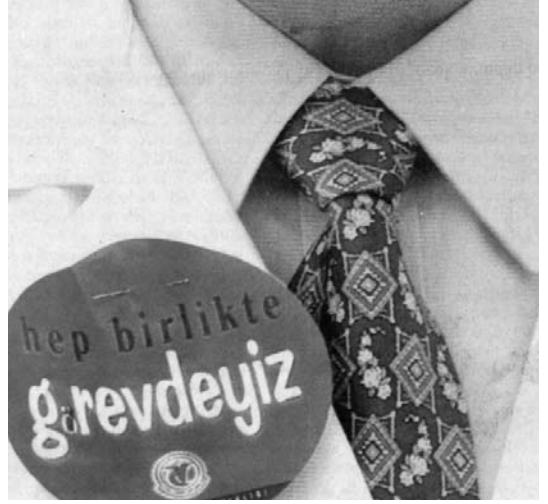
Sağlık meslek örgütleri ve sendikalar sağlığı piyasalaştırılmasına karşı kararlı bir mücadele veriyor.

a) Sosyal sigortayı toplumun tümüne zorunlu kılarak sigorta