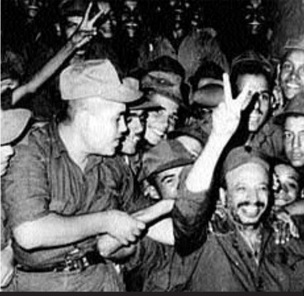
Arafat ve Filistinli savaşçılar