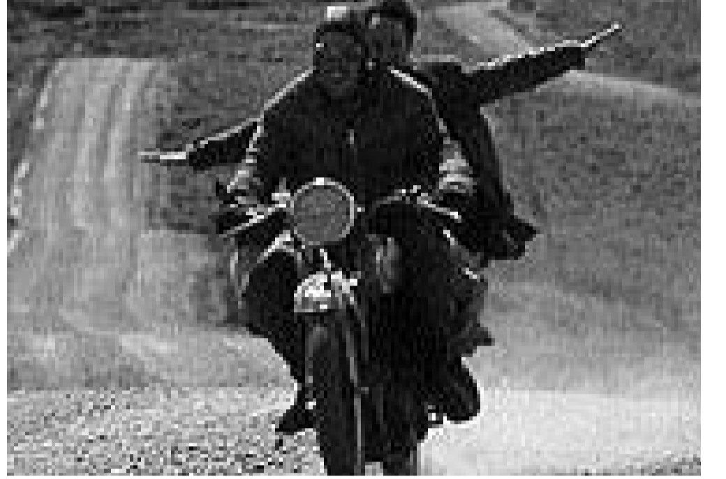
Motosiklet günlüğü için Che Guavera "ben ben olmadan önceki ben" diyor. Romantikve son derece güzel...

Güzel görüntüler eşliğinde süren yolculuk, dürüstlük, kararlılık gibi Che'nin bir dizi özelliğini