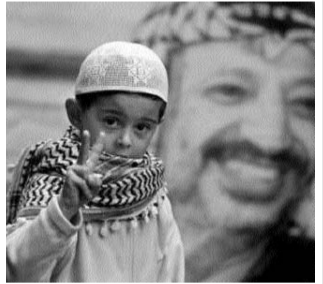
Arafat ve Filistinli çocuk