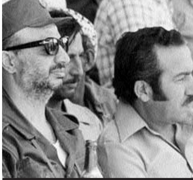
Arafat ve Ebu Cihat