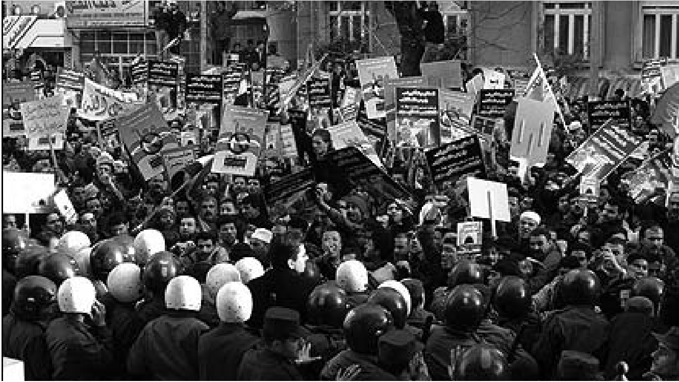
Her insan kafasından geçen herhangi bir fikri, dilediği gibi, dilediği yerde dile getirebilmeli; bu fikre insan kazanmak için özgürce örgütlenmelidir.

Ahmedinejad ırkçılığa maruz kalındığında gösterilecek en yanlış ve tehlikeli tepki örneğini tarihe kazandırmış oldu. Nasıl davranmamak gerektiğini Ahmedinejad'a bakıp anlamak kolaylaştı.