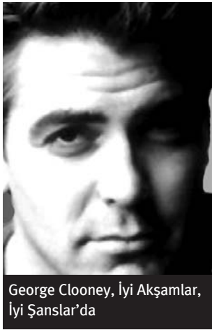
George Clooney, İyi Akşamlar, İyi Şanslar'da