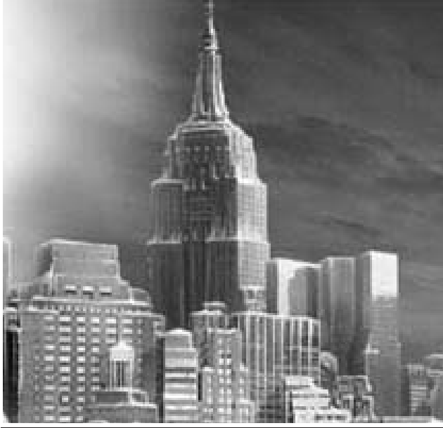
Yarıdan sonra iklim değişimini çarpıcı bir biçimde anlatıyor

John Le Carré 'in kitabından Brezilyalı yönetmen Fernando Meirelles tarafın-