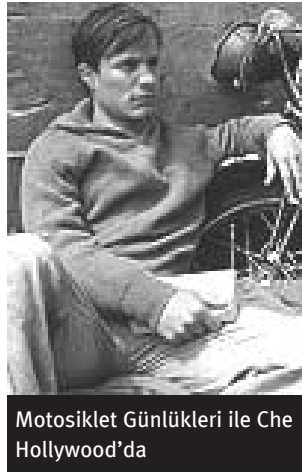
Motosiklet Günlükleri ile Che Hollywood'da

yapılan Bahçivan büyük ölçüde Afrika'da geçiyor. Bu casusluk hikayesinde Sudan'da insani yardım alanında çalışan Pete Postlethwaite silah kaçakçılığı ile büyük ilaç şirketlerinin faaliyetlerine benzetiyor. Ralph Fiennes , Rachel Fiennes ile evli bir İngiliz diplomatı oynuyor. Rachel Fiennes yaptığı deneylerle insanların ölümüne neden olan bir ilaç şirketinin peşinde. Fiennes ilaç şirketinin ilaçlarını denediği insanları Afrikalı kobaylar diye adlandırıyor. Hikâye aynı zamanda İngiltere ile büyük ilaç şirketlerinin nasıl iç içe girdiklerini de anlatıyor.