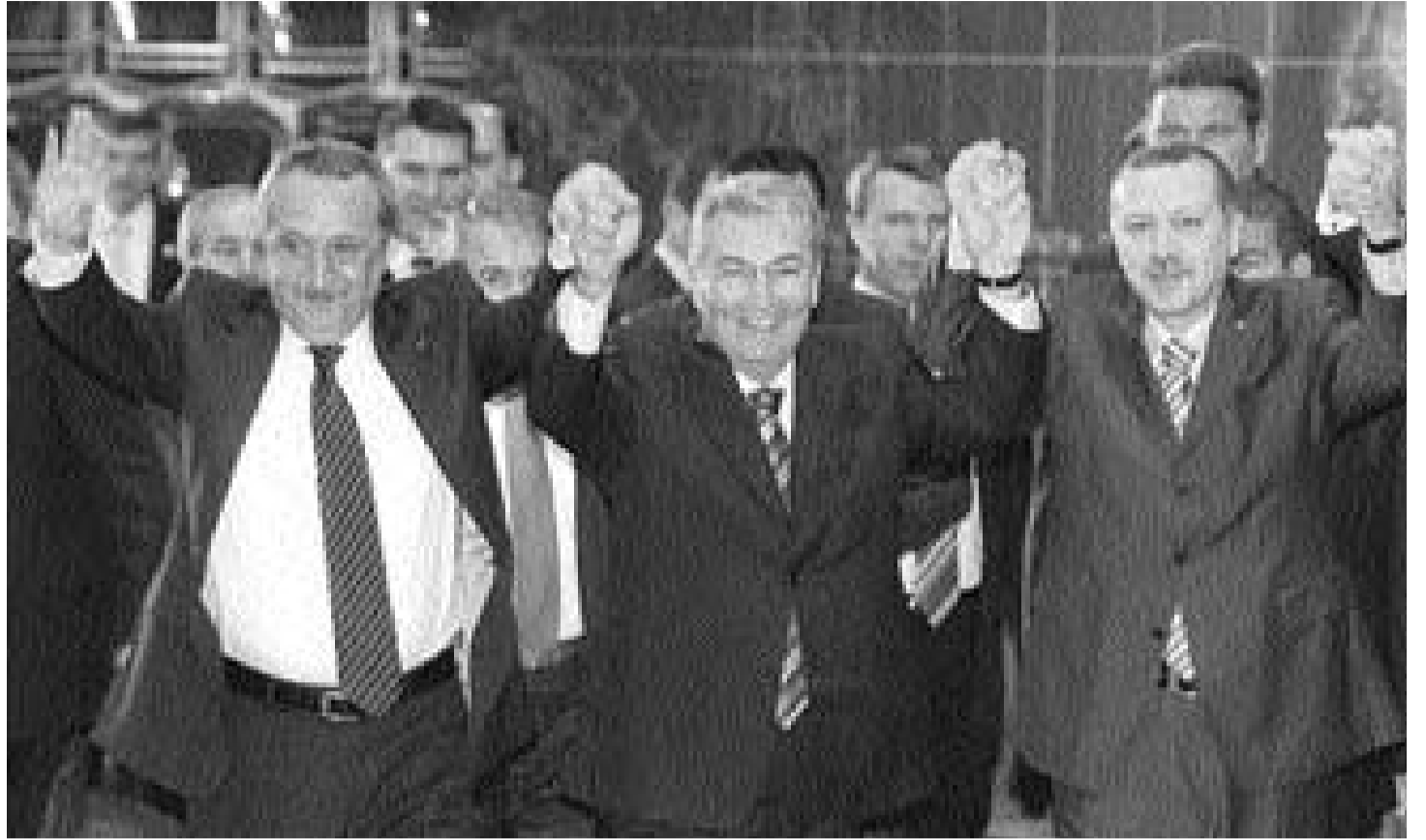
Krize sonunda patronlar el koydu. TOBB Kongresinde, birbirlerinin gırtlığını sıkın Ağar, Baykal ve Tayyip Erdoğan elele tutmak zorunda kaldılar.

Unutmadan eklemek gerekli: Hamid Karzai rejiminin bütün bu yolsuzluklara rağmen işbaşında kalması ABD ve NATO askerlerine dayanıyor ve NATO askerleri içinde Türk birliği de var.