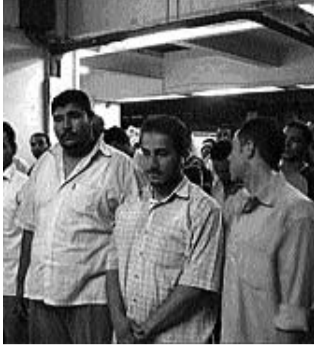
Mısırlı posta işçileri polis saldırısını bekliyor