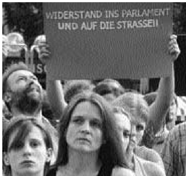
Köln'deki bir Die Linke gösterisi: Sokakta ve parlamentoda direniş.

Alman Telekomu'nda çalışan işçilerin yüzde 96'sı grev için oy verdi. Telekom işçileri halkın da