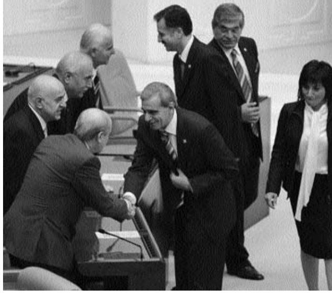
adres yanlış. Barışçı çözümün adresi MHP değil.

Açık ki DTP'li milletvekilleri barışçı, siyasi bir çözüm için adım atmaya çalışıyorlar. Topluma siyasi bir çözüm-dem yana olduklarını kanıtlamaya çalışıyorlar. Ne var ki başvurdukları