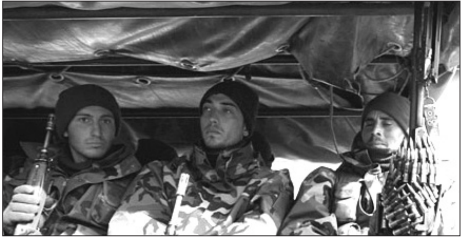
Binlerce Kürt Diyarbakır başta olmak üzere hem Kuzey'de hem Güney'de barış için sokağa çıktı. Türkiye kamuoyu Bülent Ersoy'un sözlerini tartışırken ilk kez savaş bu kadar geniş bir şekilde sorgulanıyordu.

Başbakanın operasyon sonlanmadan önce dağıttığı ulusa sesleniş konuşmasına ambargo, yani yayınlamayı talimatı konulduğu ve yenisi gönderildiği halde Doğan Grubu TV'leri başta olmak üzere bir çok kanal ilk videoyu yayınladı. Erdoğan'ın operasyon üzerinde bir etkisi olmadığı kanıtlanacaktı. Ancak bu komik plan da ters tepti. Siyasal alanda da adımlar atacağını açıklayan AKP operasyonun