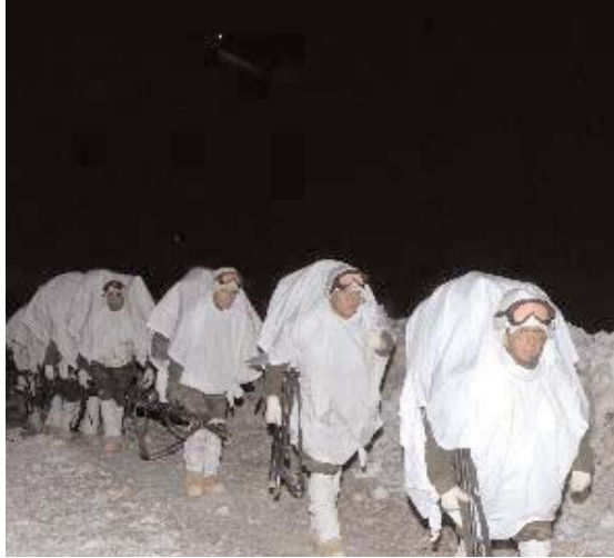
Şu ya da bu nedenle ordu Kuzey Irak'tan çekildi. Akan kan durdu. Şimdi sıra barışta...

Kazanacak olan mutlaka demokrasidir, barıştır.