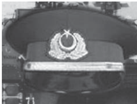
1996'da hükümet Refah Partisi ile DYP arasında