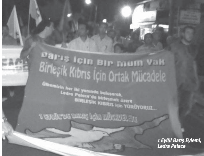
1 Eylül Barış Eylemi, Lefkara Sarayı

Adada KKTC'yi ayakta tutan 40 bin Türk askeri bulunuyor. KKTC ekonomik olarak tamamen Türkiye'ye bağlı. İşgalciler adadan çekilmelerini tartışılmasını istemiyor. Ağustos'ta, Talat ve