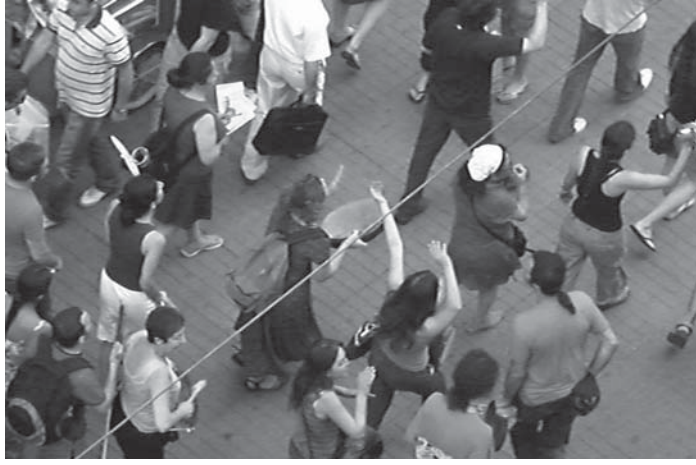
Baskın Oran aktivistleri Beyoğlu'nda yürüyor

Çarşamba günü yapacağımız Barışarock toplantısına Orhangazi'den de arkadaşlar katılacak. Önümüzdeki günlerde de bu arkadaşlarla birlikte Yalova'ya iletişime geçip orada bir Barışarock toplantısı yapmaya çalışacağız.