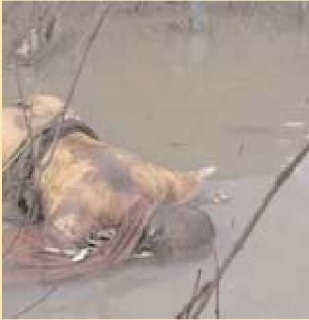
kentlerde polis ve asker sayısı daha az ve buralarda gösteriler devam ediyor. "Geçen hafta"

Geçtiğimiz haftalarda Burma'da rahipler ve gençler sokaklara çıktı. Göstericiler politik baskının sona ermesini ve demokrasi istiyorlardı. Askeri diktatörlük göstericilere şiddetle saldırdı.