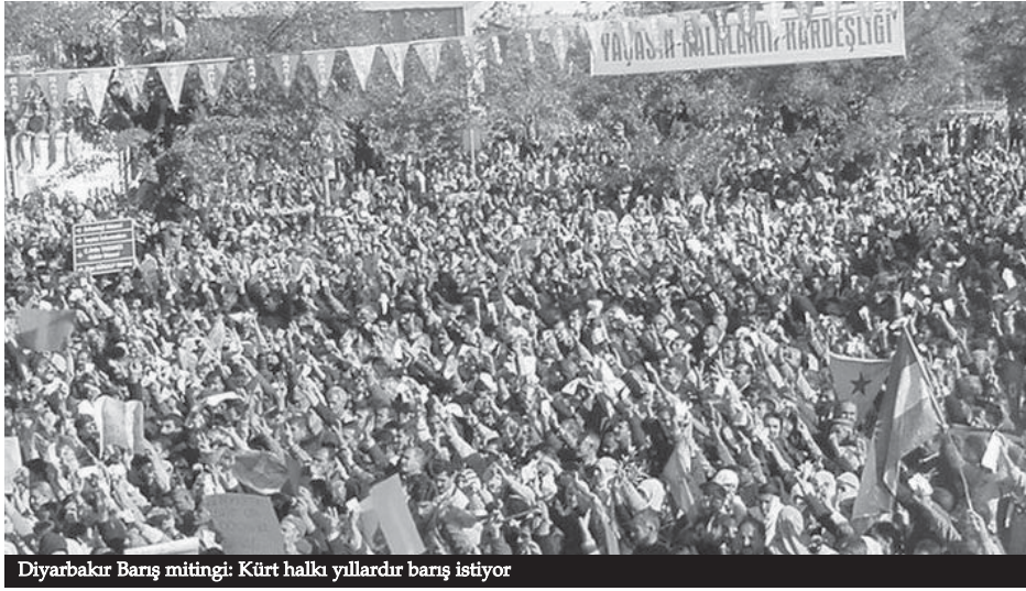
Diyarbakır Barış mitingi: Kürt halkı yıllardır barış istiyor

Emek örgütleri 3 Kasım'da Ankara'da eylem yapıyor. "Özgürlükçü demokratik eşitlikçi bir Türkiye" başlıklı eylem yeni anayasa ve demokratikleşme tartışmalarında çalışanların ne düşündüğünü, ne istediğini ortaya koyacak. Sağlık ve sosyal güvenliğin özelleştirilmesi, kamu personel rejimi adı altında iş güvenliğinin ve sendikalaşmanın yok edilmesine dikkat çeken KESK, TMMOB ve TTB, yeni-liberal saldırganlığa geçit verilmemesi için 3 Kasım'da Ankara'da buluşma çağrısı yaptı.