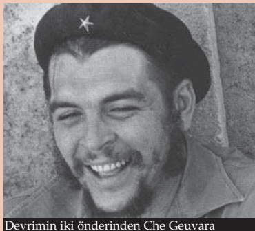
Devrimin iki önderinden Che Guevara