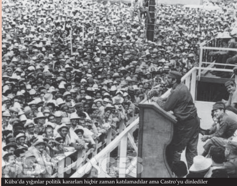
Küba'da yığınlar politik kararları hiçbir zaman katlamadılar ama Castro'yu dinlediler

bütünüyle SSCB ve Doğu Bloku'na dayalı hale geldi. 26 Temmuz Hareketi de Küba Komünist Partisi oldu. Artık Kübalı devrimcilerin örnek Rusya ve bu ülkede hakim olan stalinizmdi.