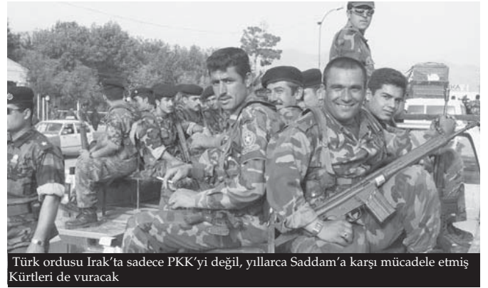
Türk ordusu Irak'ta sadece PKK'yi değil, yıllarca Saddam'a karşı mücadele etmiş Kürtleri de vuracak

Yüz kere de olsa tekrarlamak gerekir. Çözüm politiktir, çözüm barıştır.