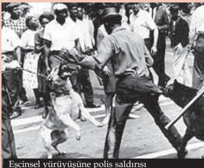
Eşcinsel yürüyüşüne polis saldırısı

Devrimci marksistler hiçbir yanılsamaya yol açmadan Küba'yı emperyalist saldırganlığa, emperyalist kuşatmaya karşı savunurlar.