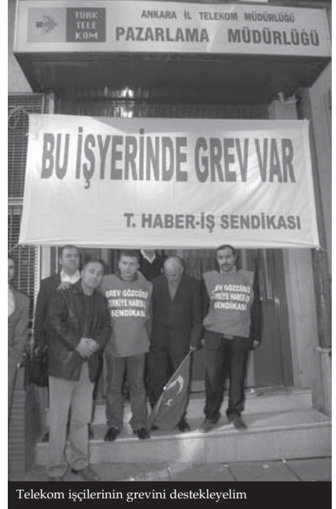
Telekom işçilerinin grevini destekleyelim

Telekom işçilerinin kazanmasını sağlayacak en önemli nokta öncelikle bu sektörde örgütlü Haber-Sen gibi diğer sendikaların dayanışmasıdır. 1. ve 2. tip sözleşmeye çalışan ve memur statüsünde bulunan Telekom çalışanları da bu mücadeleden bir parçasıdır. Ancak sadece bu da yeterli değildir, diğer sendika konfederasyonlarının ve çalışanların da bu grevi desteklemesi Telekom işçilerini kazanmaya bir adım daha yaklaştıracaktır. Dünyada 15 milyondan fazla üyesi bulunan Uluslararası Sendikalar Ağı (Global Union), Türk Telekom grevi ile ilgili olarak