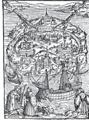
Thomas More'un Ütopya Adası

Manifesto , ütopyik sosyalist fikirlerin henüz kapitalist toplumda sınıfsal karşıtlık belirginleşmediği, işçi sınıfının henüz gelişmediği bir dönemin ürünleri olarak görülür. Dönemin ütopyik sosyalistleri bu yüzden kendilerini hem işçi sınıfının hem de