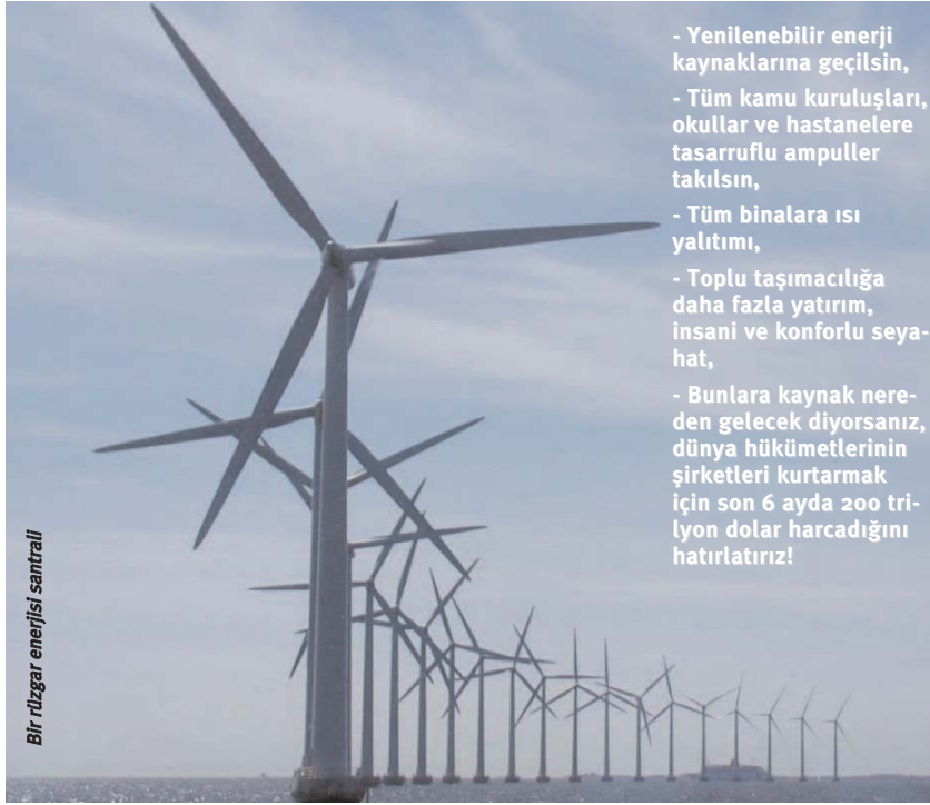
Bir rüzgar enerjisi santrali

Fedakarlık yapmak istemiyoruz. Zaten yeterince fedakarlık yapıyoruz. Doğalgaz faturalarımız yüzlerce lira geldiğinde kombileri doğal olarak kısmak zorunda kalıyoruz. Su ve elektrik