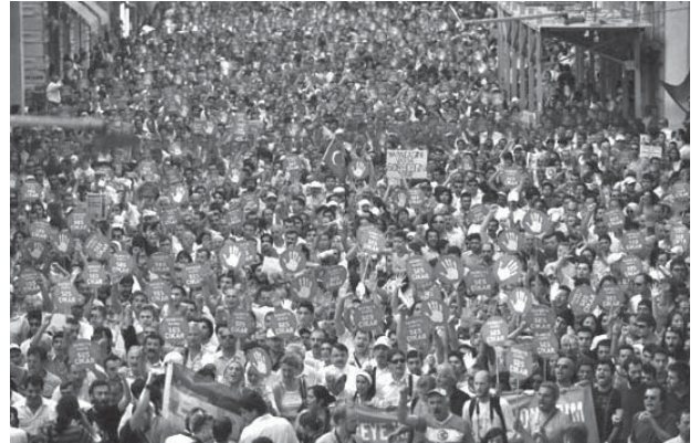
21 Haziran 2007, gerçekleşmekte olan bir darbeye karşı ilk yürüyüş

Ergenekon ve darbe yanlıları soruşturmayı engellemek için ellerinden geleni yapıyor. Ancak 2. iddianame ile seslerinin epeyce kısıldığı ortada. Yine de iddianamenin tali yanlarına gönderme yaparak işi sulandırmaya çalışıyorlar. Evet, iddianame devletin