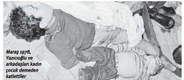
Maraş 1978, Yazıcıoğlu ve arkadaşları kadın çocuk demeden katlettiler

Bir faşist daha, işlediği insanlık suçlarından hesap veremedi gitti. Ama o medyanın inandırmaya çalıştığı şirin yüzüyle değil, kayıtlara geçmiş kanlı yüzüyle vicdanlarda hep yargılanacaktır.