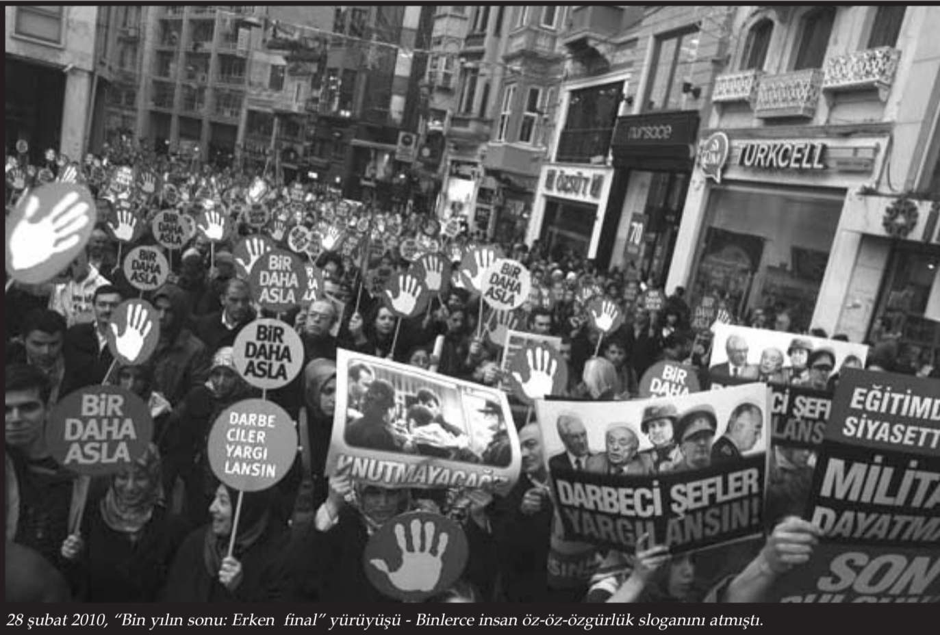
28 şubat 2010, "Bin yılın sonu: Erken final" yürüyüşü - Binlerce insan öz-öz-özgürlük sloganını atmıştı.

22-23-24 Nisan İstanbul Bilgi Üniversitesi Dolapdere Yerleşkesi