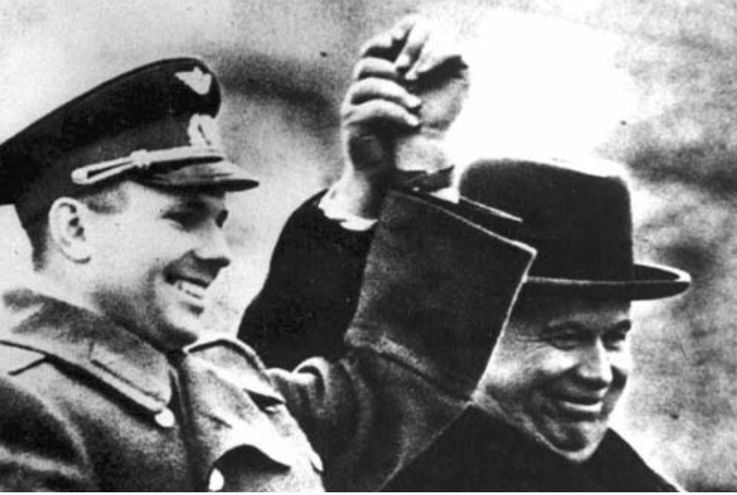
Yuri Gagarin ve SSCB lideri Kruşçev - Uzaya ilk insanı gönderen Rusya'da işçiler açlık ve baskı koşullarında yaşıyordu.