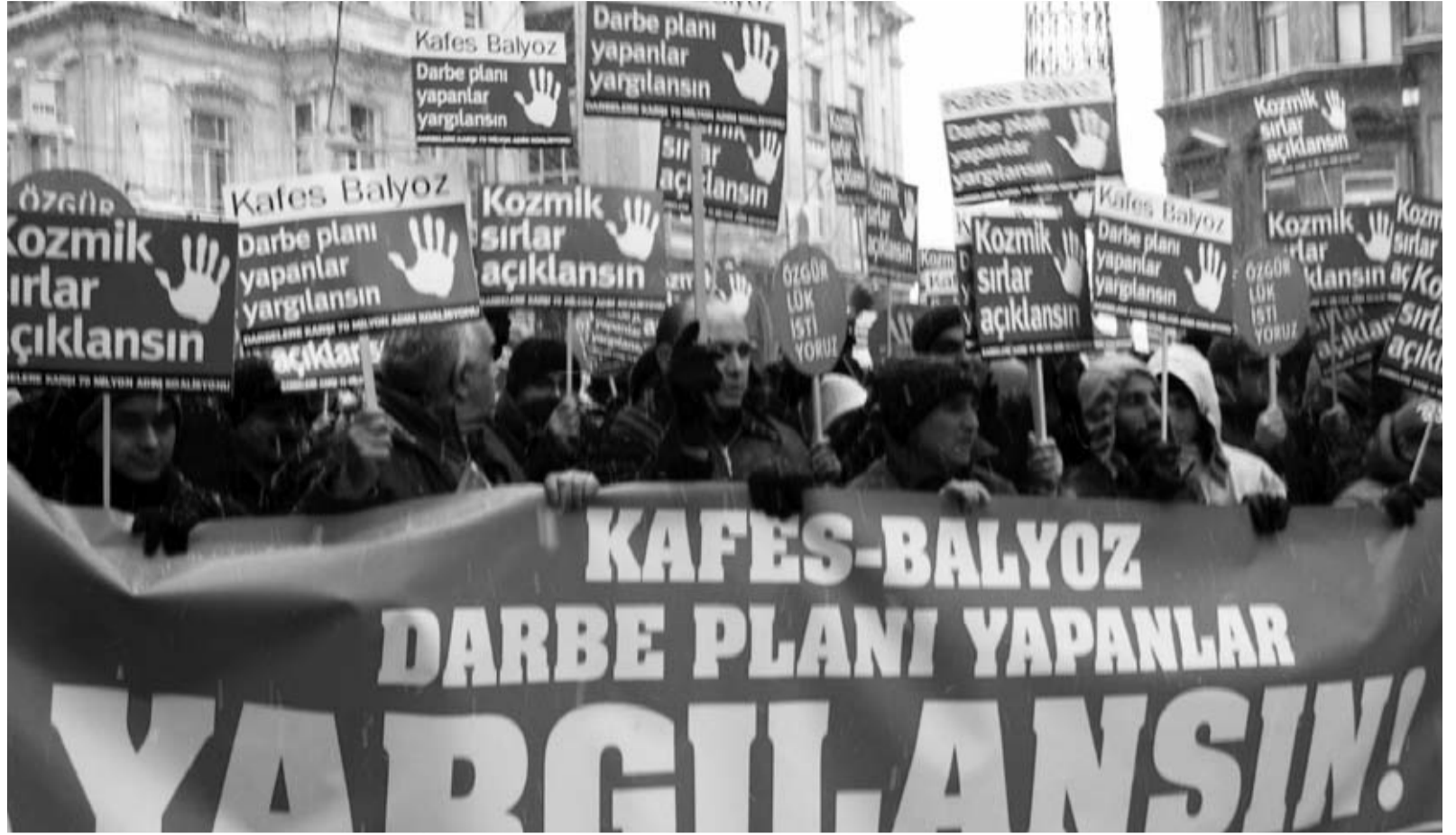
23 Ocak 2009, kara, fırtınaya rağmen binlerce insan Balyozcular yargılansın diye yürümüşü.

Darbeleri yapan güç darbeyi savununca gerek HSYK gerekse Oktay Kuban gibiler halkın vicdanında çoktan mahkûm olmuş suçluları serbest bırakıyor. Bununla da kalmıyor. Yargı, bizzat yargının bağımsızlığına gölge düşürüyor. Erzincan'daki Ergenekon'u soruşturan