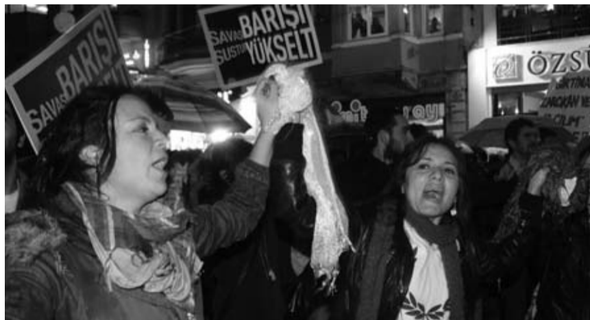
Eylem Taksim'de başladı, Tünel'de bitti. Yoğun yağmura rağmen 1,5 saat sürdü