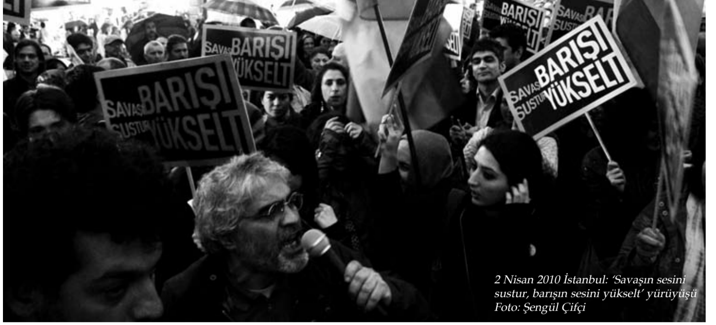
2 Nisan 2010 İstanbul: 'Savaşın sesini sustur, barışın sesini yükselt' yürüyüşü

Üçüncü yolculuğun tarafsızlık maskesi atınca demokratik sözlerle süslü demokrasi karşıtı bir yaklaşım, kaçınılmaz bir biçimde ezenden yana alınan politik bir tutum ortaya çıkmış oluyor. Devlet ve Kürtler, devlet ve başörtülüler, darbeciler ve bir siyasi parti. Başka bir deyişle devlet ve Kürt özgürlük hareketi, devlet ve başörtüsünü takma özgürlüğünü yaşamak isteyenler, devlet, darbe girişiminde bulunan provokatif bir örgüt olan Ergenekon ve milyonlarca insanın oy verdiği, yoksulların oyunu da alan bir burjuva siyasal partisi. Tarafsızlar aslında tarafsız değil, üçüncü yolcular aslında üçüncü değil en kolay yolu, egemenlerin yolunu tercih ediyor. Ortalama bilince seslenen, aman bir tatsızlık çıkmasın duygusunu harekete geçirmeye çalışan bu artık bir gelenek haline gelmiş olan sol tutumun göremediği ise şiddetli bir tatsızlığın yaşandığı politika alanında tatsızlık çıkmasın diyerek ortalama bilince seslenmek tatsızlığı üreten güççüler, muktedirler tarafına göz kırpmaktır.