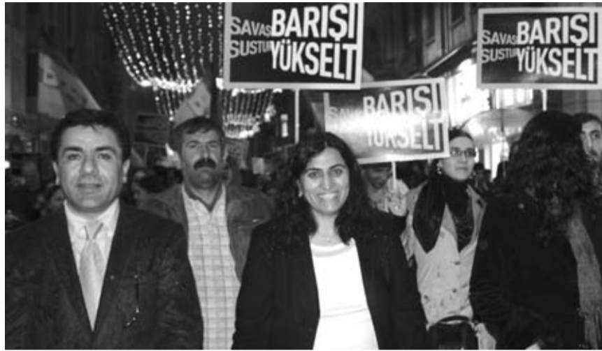
BDP Grup Başkanveki Bengi Yıldız ve BDP İstanbul Milletvekili Sabahat Tuncel.

Akşam bastırılan yoğun yağmura rağmen yürüyüş büyük bir coşku ve keyifle devam etti. Yürüyüşün sonunda Tünel Meydanı'nda BDP İstanbul Milletvekili Sabahat Tuncel bir konuşma yaptı. Tuncel konuşmasında " Bu akşam yapılan yürüyüş barış talebimizin göstergisidir. Biz yıllardır barış için sokaklardayız. Çekilen acıların son bulması için sokaklardayız. Artık geçmişte yaşanan acıların tekrarı istemiyoruz. Kürt halkının talepleri demokrasi, özgürlük, eşitlik ve adalet talebidir. Kürt sorunu bir asayiş değil tanınma sorunudur." dedi. Tuncel konuşmasında ayrıca, yıllardır yaşanan bu savaştan, ölüm haberlerinden ve gençlerin cenazelerinden bıkkınlığını ve barış talebinin artık sadece doğuda değil batıda, güneyde, her yerde dile getirildiğini belirtti. Ne Ceylanların ne de Serapların ölmemesinin yolu bugün burada olduğu gibi barışın sesini birlikte yükseltmekten geçer vurgusu ile biten konuşmanın ardından. Yürüyüş çekilme kardeşlik horunu ile sona erdi.