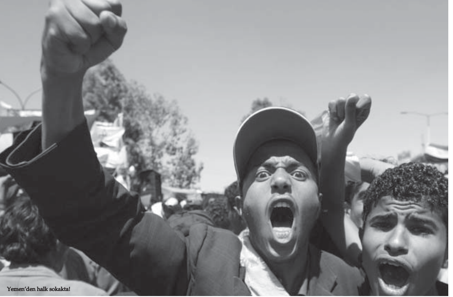
Yemen'den halk sokakta!