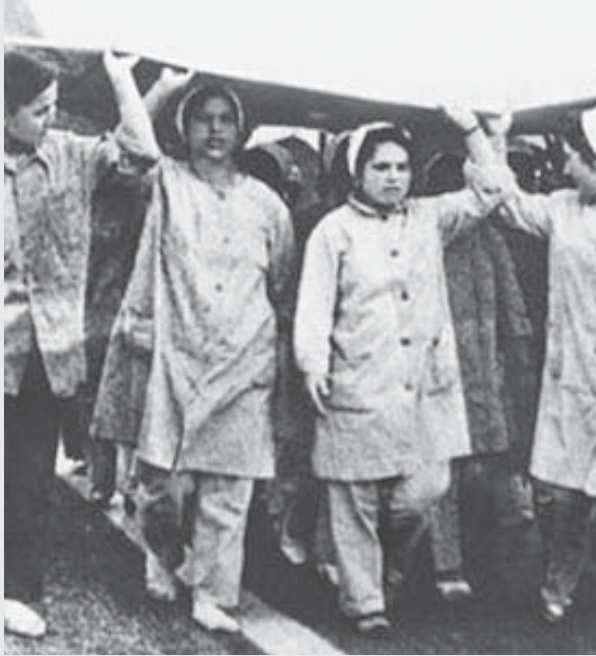
15-16 Haziran büyük işçi ayaklanmasındaki kadın işçiler.

Sistemin hakim olduğu bütün araçlarla her gün propagandasını yaptığı, pratik olarak hayata geçirmekle kalmayıp ideolojik olarak da ikna ettiği fikirlerden biri de cinsiyetçilik. Bugüne kadar birçok kazanım elde edilmiş olmasına rağmen hala hakim olan fikir kadının misyonunun çocuklarının anası, evinin kadını ve erkeğinin her türlü isteğini karşılayan daimi bakıcısı olduğu. Kadını ezen, aşağılayan, sömüren fikirler karşı verilen mücadele aynı zamanda bu sistemin temel ideolojilerinden birini çürütmek demek. Bu yüzden kadın özgürlük mücadelesi ile kadınların ezilmesinin kaynağı olan kapitalizme karşı mücadele birbirlerine