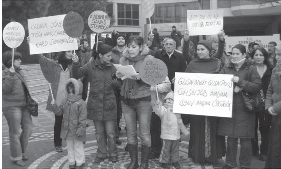
8 Mart'ta Çerkezköy'de sokağa çıkan DSİP'li ve BDP'li kadınlar özgürlük istedi