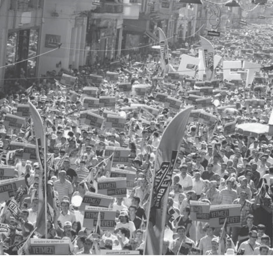
Türkiye'de 'Yetmez ama Evet', Kürdistan'da 'Boycot' diyenlerin yan yana gelmesi AKP'yi durdurabilecek tek seçenektir.