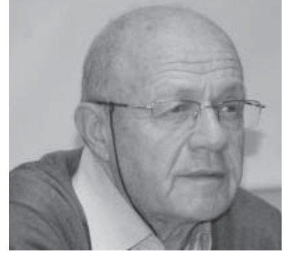
İsmail Beşikçi, Kürt gerçeğini yazdığı için yıllarca zindanda tutuldu, şimdi yine hapse gönderiliyor