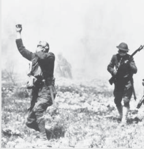
1. Dünya Savaşı'nda milyonlarca insan ölmüştü.

Ulusal çıkar denen şeyin aslında egemen sınıfların kendi çıkarları için ezilenleri sahaya sürmesi olduğu kavrandığı zaman, "devrim-