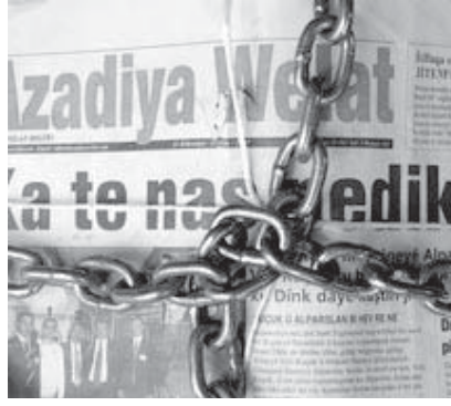
Basına dönük baskılardan en fazla nasibini alan ilk ve tek Kürtçe gazete Azadiya Welat.