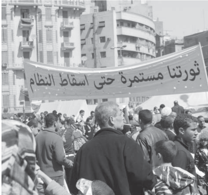
Tahrir Meydanı'nda her gün gösteri var.

Devrimi derinleştirme mücadelesinin bir parçası da karşı-devrimci istihbarat örgütünü tamamen yok olmasını sağlamak. Halk ülkedeki istihbarat merkezlerine girerek insan hakları ihlalleriyle