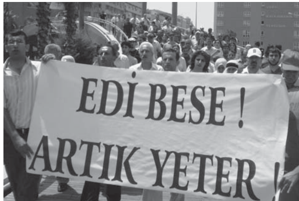
Newroz'a kadar olan kısa süre barış için mutlaka değerlendirilmeli

Şubat ayı sonunda toplanan Milli Güvenlik Kurulu'nun (MGK) sonucunda, "terörle mücadele"de taviz verilmeyeceği açıklandı. Bu,