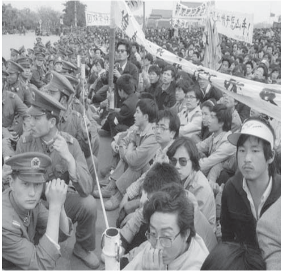
1989 Haziran-Tiananmen Meydanı

Bugünkü adlarıyla ulusalacılar, dünün Türk milliyetçileri ve ırkçılar, tüm zamanların ırkçıları ne barış ne özgürlük ne de demokrasi getirir. Onlar Kürtlerin, Alevilerin, Ermenilerin, sosyalistlerin ve demokratların katlidir.