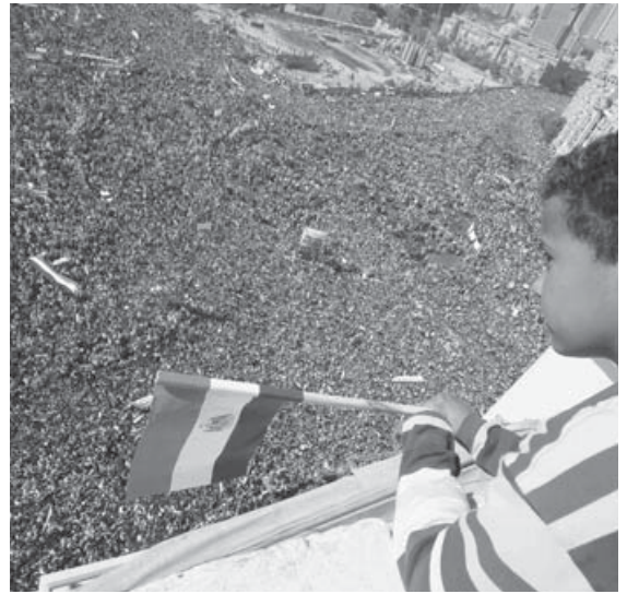
Çin. 2011 Ocak-Tahrir Meydanı, Mısır