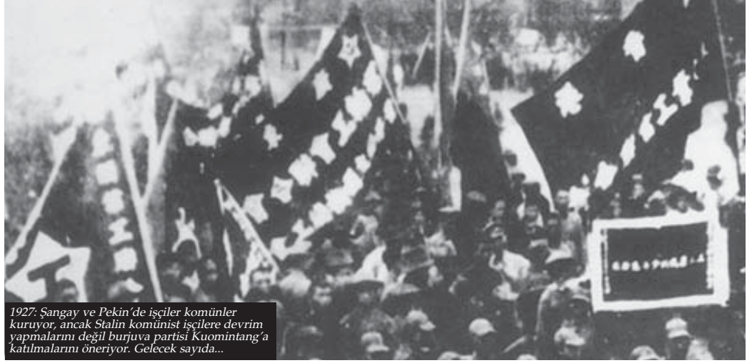
1927: Şangay ve Pekin'de işçiler komünler kuruyor, ancak Stalin komünist işçilere devrim yapmalarını değil burjuva partisi Kuomintang'a katılmalarını öneriyor. Gelecek sayıda...

Mao Zedung'un önderliğindeki ikinci devrim, devlet kapitalizminin kuruluşu, Tiananmen Meydanı'nda demokrasi isteyen öğrencilerin ve işçilerin üzerine gönderilen tanklar, küresel kapitalizmin en büyük güçlerinden birine düşen Çin - Yusuf Topuzoğlu, Sosyalist İşçi için hazırladığı yazı dizisinin ilkinde Çin'de olan bitenleri özetliyor. Sonraki sayı'da: Yitirilen Devrim 1927