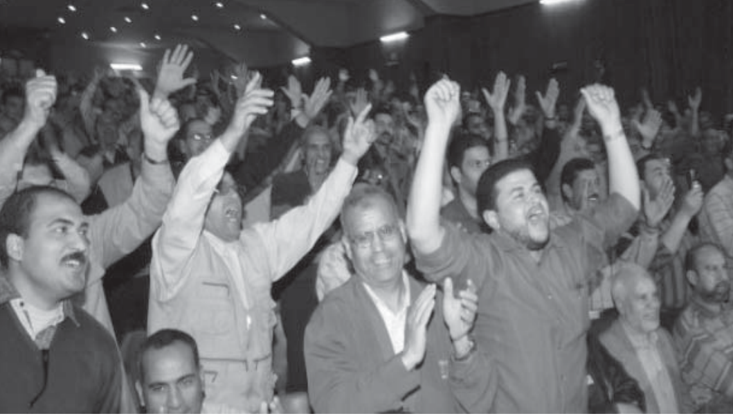
Mısır Devrimi'nin merkezlerinden biri olan Mahalla al-Kubra'daki tekstil atölyelerinde işçilerin grev toplantsından...