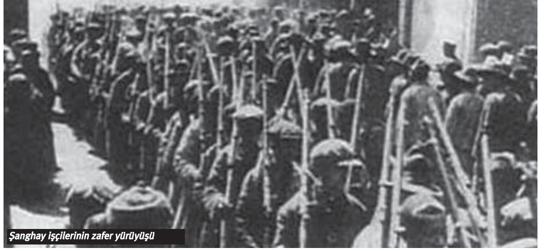
Şanghay işçilerinin zafer yürüyüşü

Moskova için Çan Kay-şek ile yapılan anlaşma çok önemliydi.