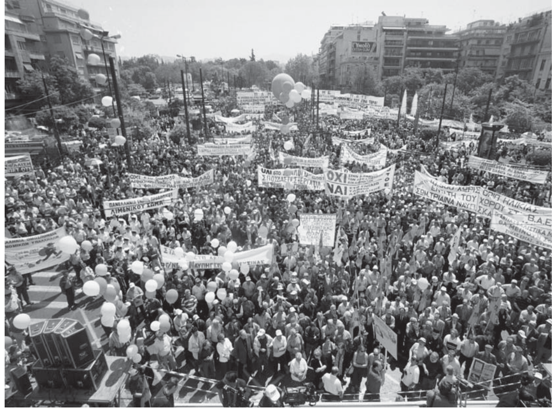
Gazetemiz yayına hazırlandığı sırada Yunan işçi ve memur sendikaları 24 saatlik genel grev kararı almıştı. Son iki yılda bir çok genel grev yapan Yunanistan işçi sınıfı krizin faturasunu ödememek için direniyor.

Bu kriz yüzünden hem kapitalizm yoluna devam edemiyor hem de bir türlü çözüme kavuşturulamayan sorunlar kendini dayatıyor. Çünkü bu çözülemeyen sorunlar, egemenlerin karar vermesi zor ikilemlerle karşı karşıya kalmasına yol açıyor.