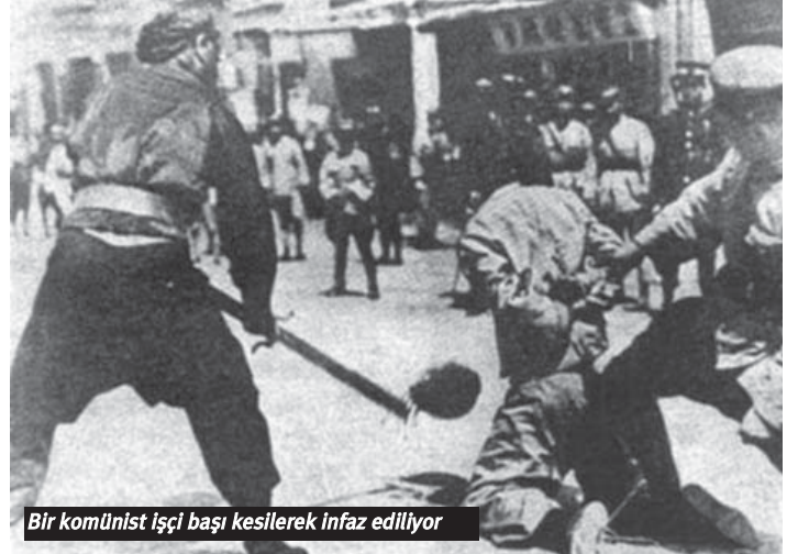
Bir komünist işçi başı kesilerek infaz ediliyor

Kuamingtang kendi içindeki Komünistler'in listesini istedi ve sonunda bu listeyi aldı ve hepsini örgütten çıkardı.