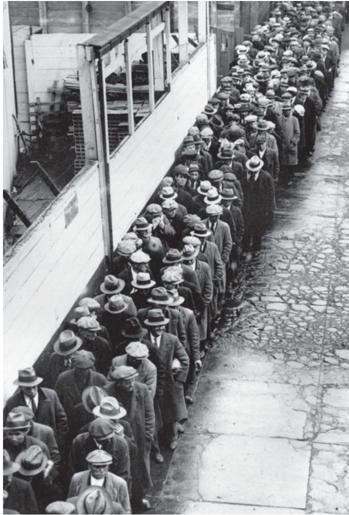
1929 Ekim'inde ABD borsası iflas etti. ABD'de milyonlar işsiz kalırken, dünya ekonomisi 12 yıl süren büyük bir çöküş dönemine girdi. İşsizlerin oluşturduğu kuyruklardan biri.

İngiltere Ulusal İstatistik Ofisi'nin tahminlerine göre, İngiltere ekonomisi 2007 yılının sonlarından