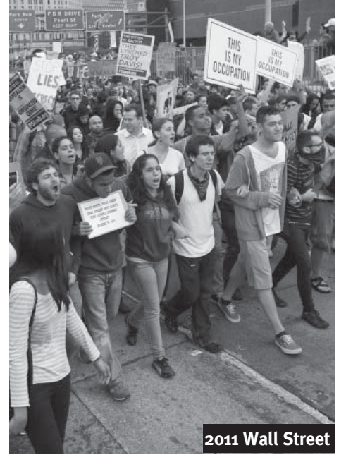
2011 Wall Street