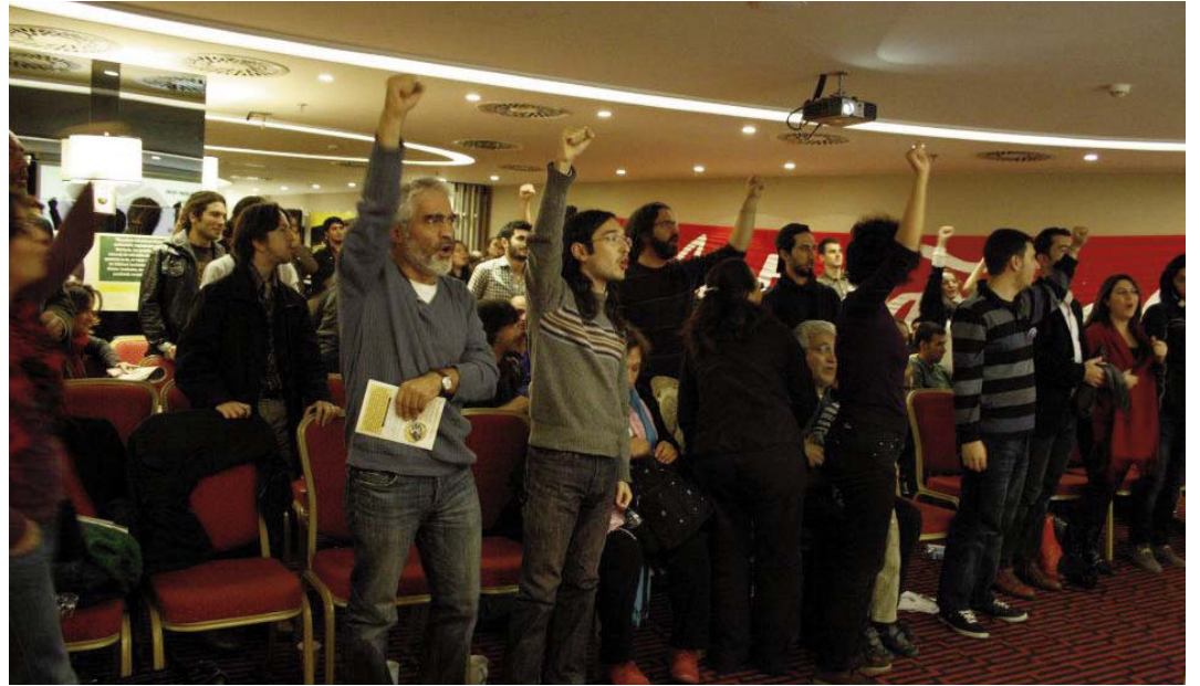
Marksizm2011, Enternasyonal marşıyla son buldu.

"Jakobenizm, halkçılık, İttihat ve Terakki" toplantısının konuşmacısı, Hrant'ın Arkadaşları 'ndan Garo Paylan ise Ermeni halkının gözünde itihatchılığın ne demek olduğunu bir çok örnekle aktardı. Bu politikanın toplum üzerinde çok derin bir yara kadar, etki de yaptığını ve gündelik milliyetçilik olarak karşımıza çıktığını ifade etti. Bu toplantının diğer konuşmacısı ise DSİP MK üyesi Yıldız Önen di. Önen, İttihatçılığın tarihini, kemalizmin bu siyasi geleneğin sürdürücüsü olduğunu ve bu tarihle hesaplaşmanın önemi