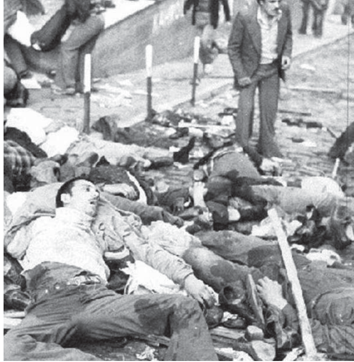
12 Haziran 1980, İnciraltı katliamı - Ülkücü faşistler İzmir'de 6 öğrenciyi katletti.

Almanya örneği gösterdi ki faşizm üzerine kafa yormak beylik laflarla sürgit tartışmak değildi. Faşizm üzerine tartışmak ve doğru analiz etmek ölüm kalem meselesiydi. Dün olduğu kadar bugün de faşizmin doğru analizi oldukça önemli. Faşizm kapitalizmin kendine özgü koşullarında ortaya çıkmış ve sonrasında ilelebet tarihe gömülmüş bir olgu değil. Bir benzetme yapmak gerekirse faşizm kapitalizmin ölümcül bir virüsüdür . Bu virüse neden olan etkenler ortadan kalkmadan tam anlamıyla faşist hareketlerden kurtulmak mümkün değildir. Bu kapitalizm