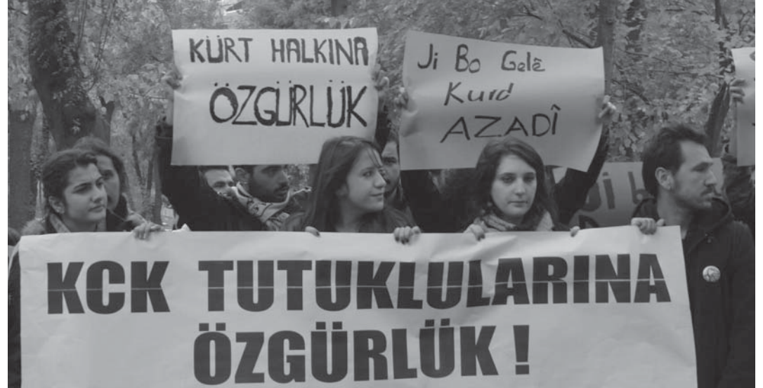
İstanbul Bilgi Üniversitesi öğrencileri tutuklama ve gözaltı terörünü protesto ederken...

İşçi ve emekçilerin brüt ücretlerinin üçte biri vergilere giderken birde KDV ve ÖTV adıyla vergi veriyorlar. Alınan her temel tüketim maddesinde verilen vergiler bütçe gelirlerinin çok önemli bir kısmını oluşturken emekçiler ise yaşayamaz hale gelmektedirler.