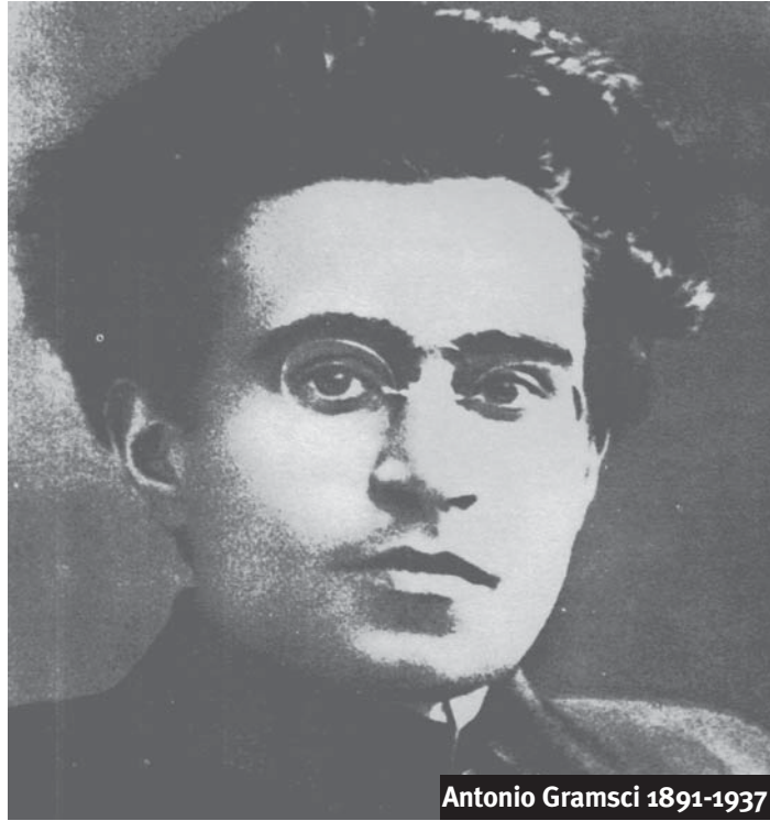
Antonio Gramsci 1891-1937

Üst yapıya geldiğimizde, Gramsci tekrar ikiye bölecektir bunu. Bunlardan biri politik toplumdur. Politik toplum zora karşılık gelir, devletin zor uyguladığı alandır. İkinci