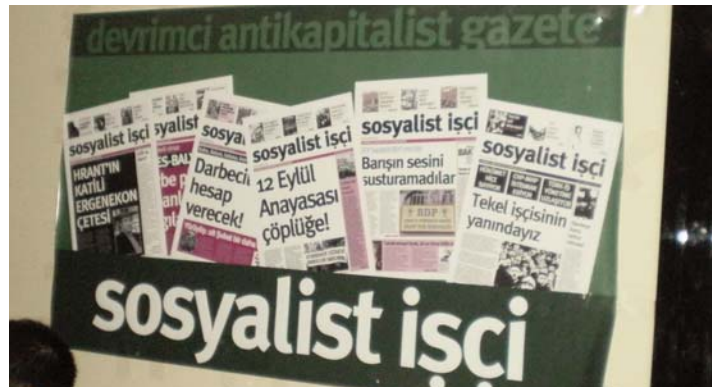
Marksizm2011'de gazetemiz okurlarıyla buluştu.