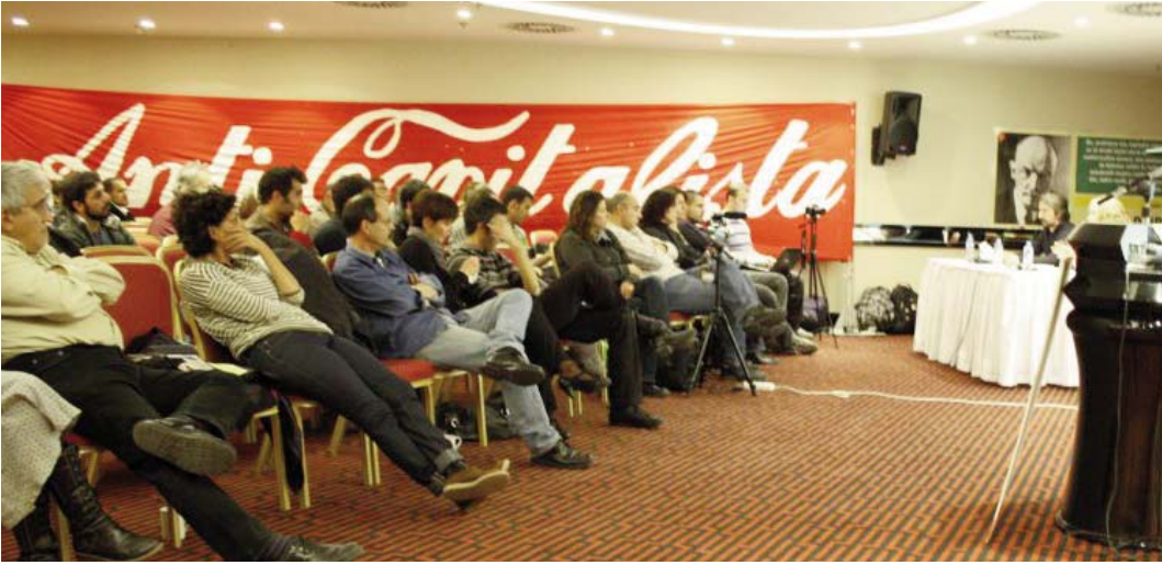
Marksizm 2011'e katılan yüzlerce kişi Mısır'ı, Yunanistan'ı, Wall Street işgalini, devrimi tartıştı.