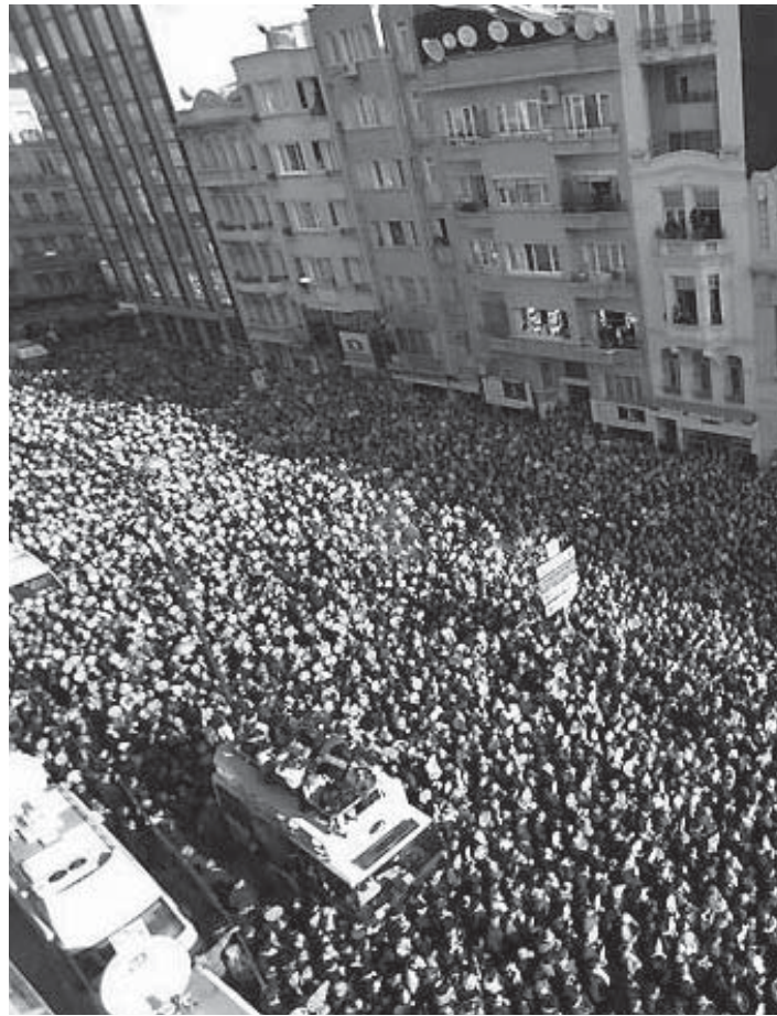
Hrant Dink'in cenazesinde yüzbinler "Hepimiz Ermeniyiz" diye yürümüştü.