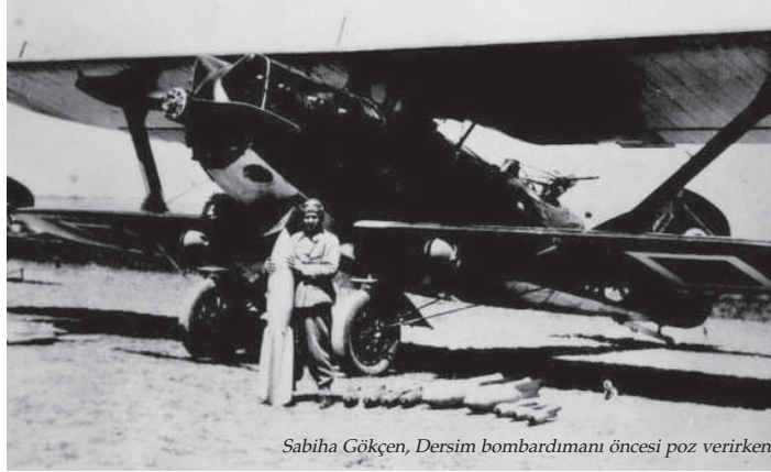
Sabiha Gökçen, Dersim bombardmanı öncesi poz verirken

sıkıştıran AKP ise meclisin araştırma komisyonu kurmasını, devlet arşivlerinin açılmasını, Dersim'i bizzat bombalayan Atatürk'ün manevi kızı Sabiha Gökçen'in isminin İstanbul'daki havalimanından çıkarılmasını istedi. CHP ise bu önerilere sudan gerekçelerle karşı çıkıyor.