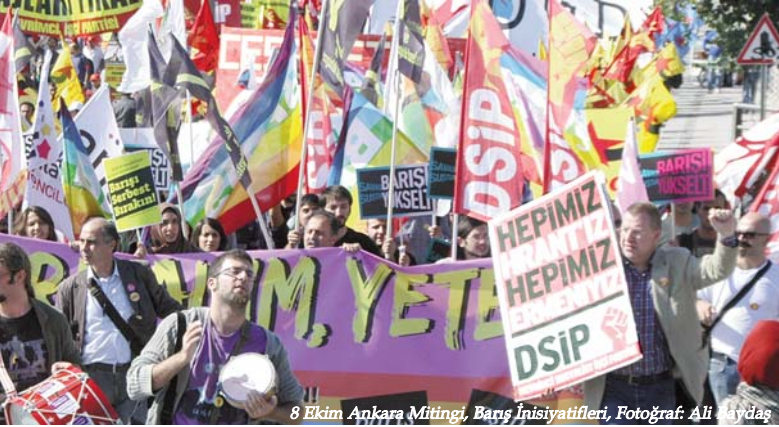
8 Ekim Ankara Mitingi, Barış İnisiyatifleri, Fotoğraf: Ali Kaydaş