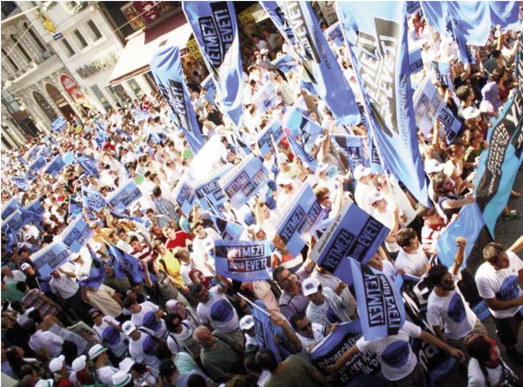
28 Ağustos 2010, referanduma iki hafta kala İstanbul'da yapılan yürüyüşe 30 binden fazla yetmez ama evetçi katılmıştı.

ölçülerde de olsa genişlemesi için mücadele etmenin sloganıdır.