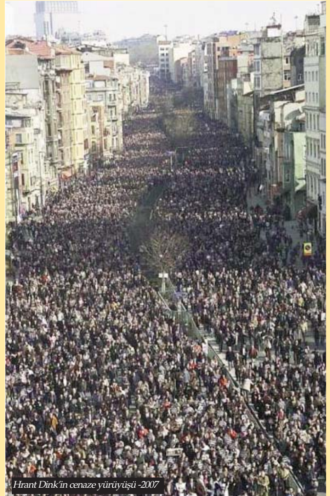
Hrant Dink'in cenaze yürüyüşü -2007

İrkçılığa ve Milliyetçiliğe Dur De Girişimi ile İHD İrkçılık ve Ayrımcılığa Karşı Komisyon Çağlayan Adliyesi'ne giderek "Hocalı katliamı anması" adı altında Ermenilere karşı ırkçılık üzerinden kurgulanan gösterinin tertip komitesi ve mitingde konuşan İçişleri Bakanı İdris Naim Şahin hakkında suç duyuru yaptı. Buradan ayrılan grup daha sonra Agos gazetesine destek ve dayanışma ziyaretinde bulundu.