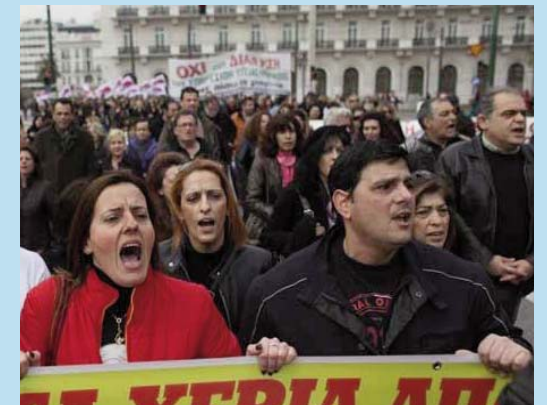
Yunanistan işçi sınıfı geri adım atmıyor!

Solun üzerine düşen bir başka önemli görev ise İslam düşmanlığına karşı mücadele. Neo Naziler göçmen düşmanlığı ile İslam düşmanlığını birlikte sürdürüyorlar.