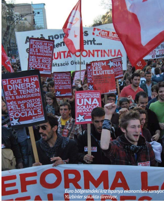
Euro bölgesindeki kriz İspanya ekonomisini sarsıyor. Yüzbinler sokakta direniyor.

Yunanistan'ın Avro'dan ayrılması Avrupa bankacılığını şiddetle etkileyecek ve tahminlere göre 2008'dekine benzer yeni bir bankalar krizi yaşanacak. Üstelik bu bankalar krizi sadece İspanya ve İtalya'yı değil, İngiltere ve Fransa başta olmak üzere diğer Avrupa