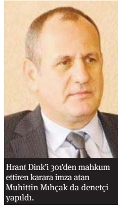
Hrant Dink'i 30'rden mahkum ettiren karara imza atan Muhittin Mıhçak da denetçi yapıldı.