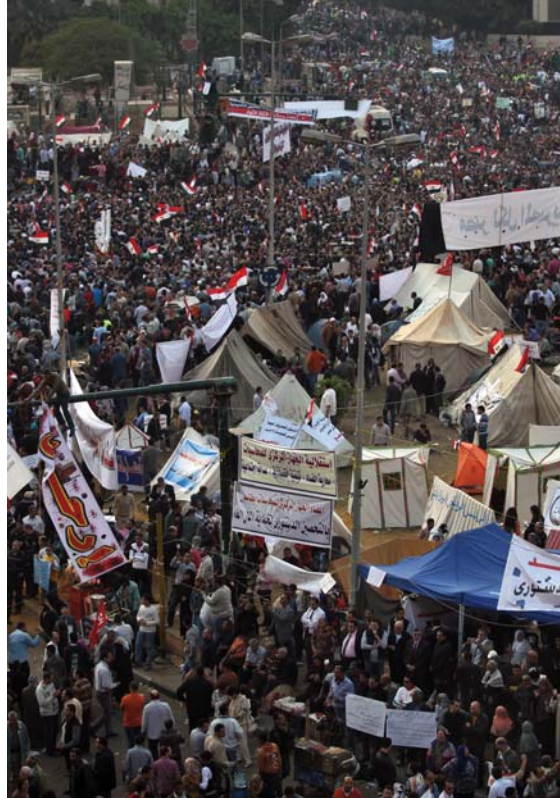
On binler 27 Kasım protestusunda Tahrir Meydanı'nı doldurdu

DSİP'in kardeş örgütü Devrimci Sosyalistler, bugünkü görevin Müslüman Kardeşlerin sermaye yanlısı politikalarını teşhir ederek onların tabanını kazanmak olduğunu vurguluyor. Safların İslamcı-laik olarak değil, devrim yanlısı-düzen yanlısı olarak kurulması gerektiğini savunuyor. Hem ABD ve patronlarla uzlaşan Müslüman Kardeşleri, hem yeniden toparlanmaya çalışan Mübarek dönemi kalıntılarını, hem de "laiklik" maskesi altında işçiler konusunda Müslüman Kardeşlerle aynı görüşleri paylaşan liberalleri teşhir etmek ve işçi sınıfı mücadelesini birleştirmek gerektiğini savunuyorlar.