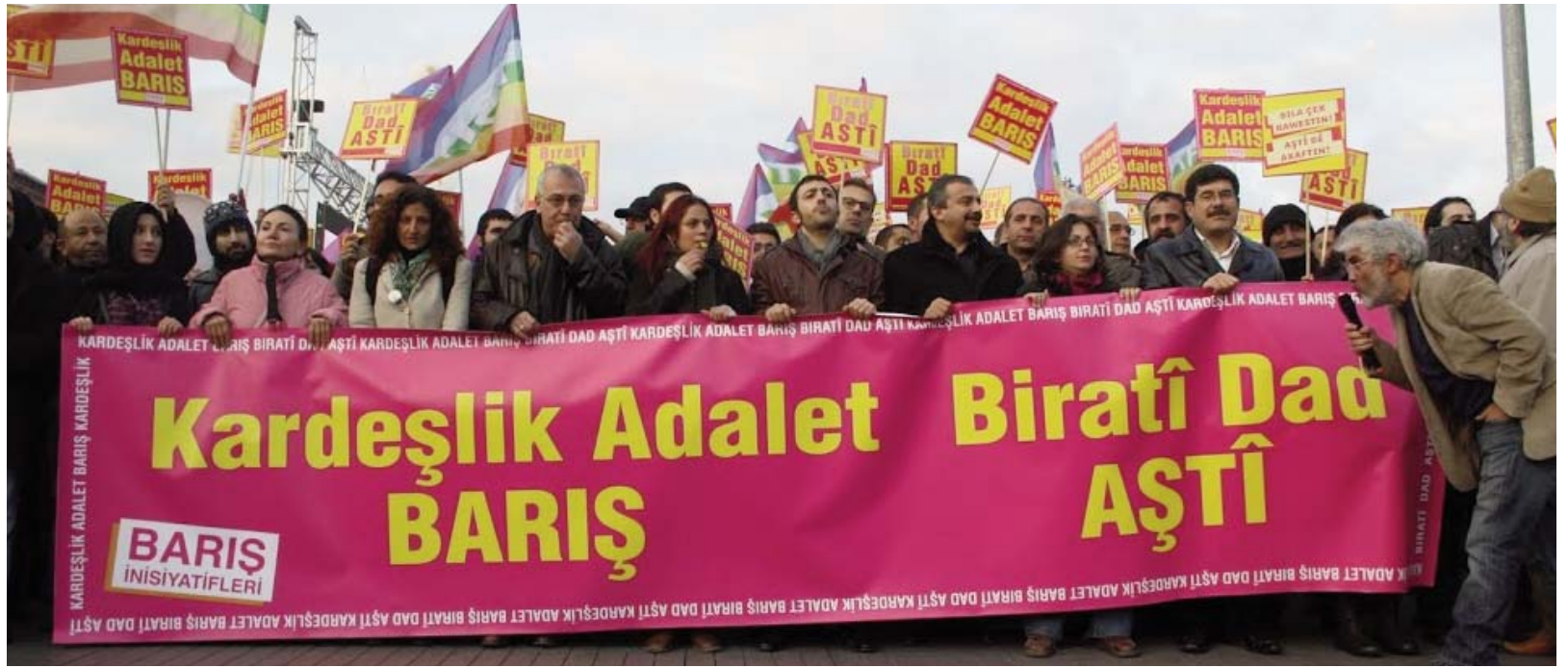
Son iki yılda Batı'da en kitlesel banş eylemlerini Banş İnisyatifleri gerçekleştirdi. Bunun nedeni her görüşten banş yanlısını birleştiren bir dile ve mücadele önerisine sahip olmasıydı.

19 Ocak'ta, cinayeti planlayan, işleyen ve katillerin işini kolaylaştırıp tüm karanlık mekanizmayı kollayanları köşeye sıkıştırmak zorundayız. Bugünden itibaren ulaşabildiğimiz her yerde Hrant için, adalet için yaygın bir kampanya yapmalıyız. Yine Agos'un önünde yine aynı saatte buluşmalıyız.