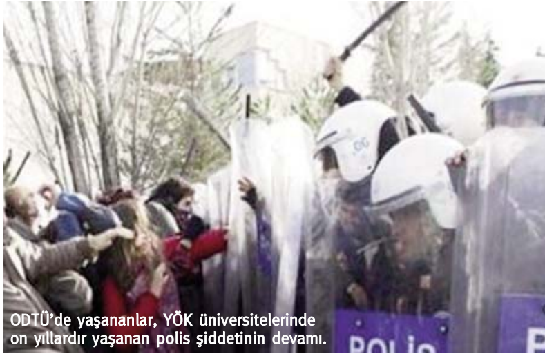
ODTÜ'de yaşananlar, YÖK üniversitelerinde on yıllardır yaşanan polis şiddetinin devamı.

AKP'liler tarafından üretilen ODTÜ'de öğrencilerin 'karanlık güçler tarafından' harekete geçirildiği, cam kırıp banka soydukları, polisi dövdükleri ve kendilerini dövmesi için kışkırttıkları, bıçakla gezdikleri gibi saldırgan argümanlara karşı ODTÜ'lülerle dayanışmak önemli, ancak yetmez. Öğrenim döneminin sonuna yaklaşırken ortaya çıkan bu