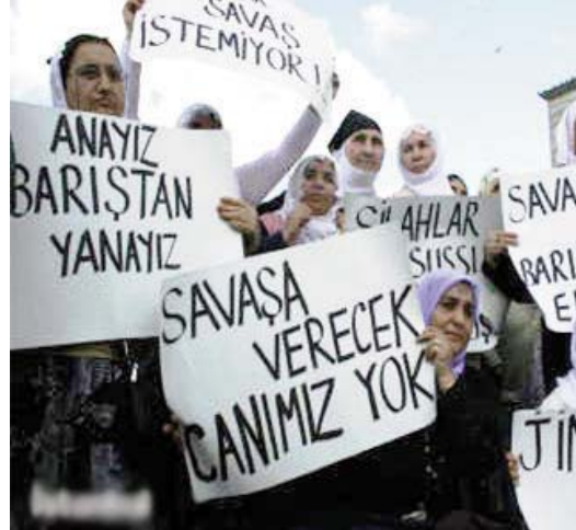
Banış Anneleri'nin "Artık yeter, kadınlar savaşa istemiyor" eylemi, İstanbul, 2011

Öcalan BDP heyeti ile yaptığı görüşmede CHP-MHP blokunu "faşist" olarak niteleyerek net bir tavır aldı. Yeni anayasada başkanlık sistemine destek vereceklerini söyleyen PKK lideri, yeni bir dönemin başlanacağını belirterek, AKP'yi kendi hegemonyasını kurmaya