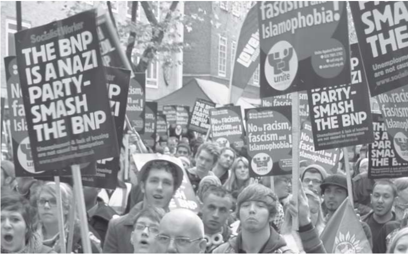
Yükselen ırkçılığa karşı mücadele Avrupa'nın her yerinde antikapitalistlerin gündemi.

AB parlamentosundaki siyasi grupların milletvekili sayılarının yaklaşık olarak şu şekilde olması bekleniyor. Merkez sağ Avrupa Halklarının Partisi 211, Merkez sol Sosyalistlerin ve Demokratların İlerici Birliği 193, Liberal Birlik 74, Yeşiller 58, sosyalist Avrupa Birleşik Solu 47, AB karşıtı Avrupa Muhafazakarlar ve Reformistler Birliği 39, ırkçı Özgürlük ve Demokrasi'nin Avrupası 33.