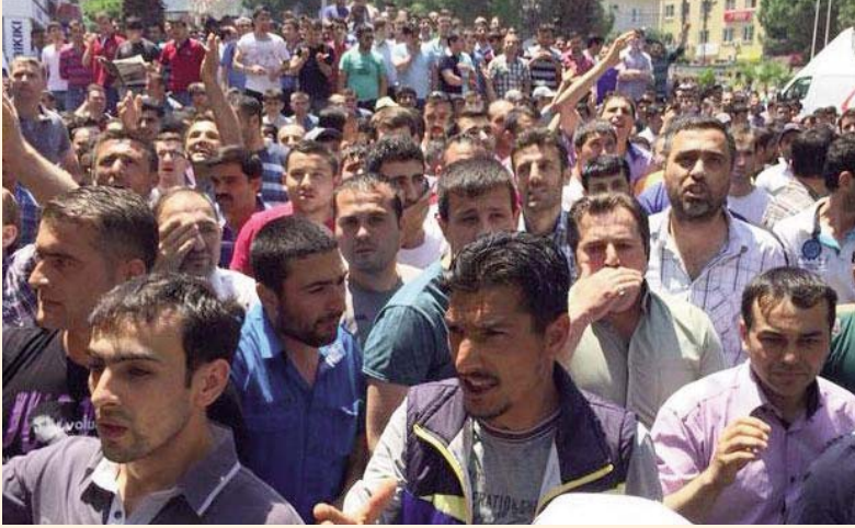
Somali maden işçileri öfkesi, önce sendikaya uğradı. Sıra tüm maden patronları ve hükümette.