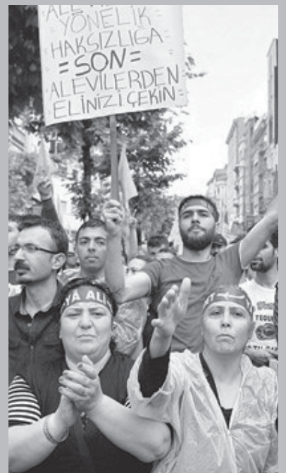
Alevilere yönelik ayrımcılık son bulmalı, Cemevleri'nin ibadethane statüsü tanınmalı.

Osmanlı'dan bu yana Aleviler hep ikinci sınıf vatandaş olarak görüldü. Katliamlara, sürgünlere uğradı. Cumhuriyet bu durumu değiştirmede; 1938 Dersim, 1978 Maraş, 1980 Çorum, 1993 Sivas ve 1995 Gazi Mahallesi katliamları Alevi toplumunun baskılanmasına sebep oldu. Alevilerin gözünde AKP bu geleceğin devamcısı: Zorunlu din dersinin kalkması, diyanetin lağvedilmesi, cemevlerine resmi statü verilmesi gibi taleplere kulaklarını kapamanın yanı sıra, AKP'nin Suriye konusunda mezhepci bakışı, Erdoğan'ın anamuhalefet lideri Kılıçdaroğlu'nu mitingte "Biliyorsunuz Alevi" diyerek yuhalatması, Alevilere dönük ırkçı saldırı ve tacizlerin sürdürülmemesi Alevilerin öfkelerini artıran unsurlar. Alevilerin talepleri kabul edilmeden, Alevilere yönelik ayrımcı politikalar son bulmadan özgürlük ve demokrasiden bahsetmek imkansız!