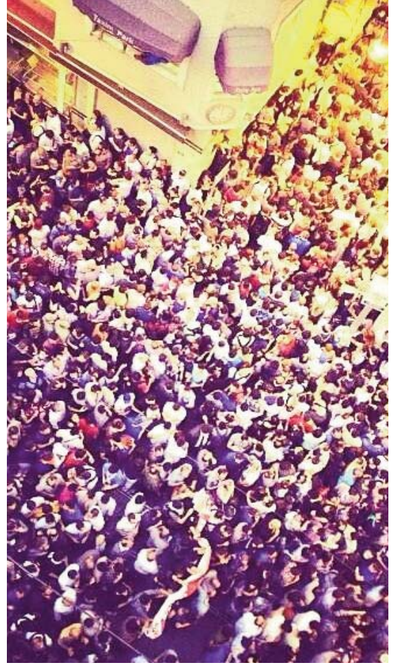
Gezi Parkı direnişi yüzbinlerce insanın korku duvarını aşmasını sağladı.

Bugün Türkiye'de giderek artan üniversite sayısı, öğrenciler için bazı ayrıcalıklar yaratsa da bu aynı zamanda onları işçi sınıfından tamamen kopamayan teknisyenler ve idareciler durumuna getiriyor. Öğrencilerin bir dönem çok prestijli olan bölümlere yığılıp sonrasında işsiz kalması veya çok düşük maaşlarla eski prestijinden tamamen yoksun hale gelen bu işlerde çalışacak durumda olmaları onların hoşnutsuzluğunu arttırıyor. Bu çelişkiler Gezi'deki öğrenci kalabalığını anlamamıza yardımcı oluyor.