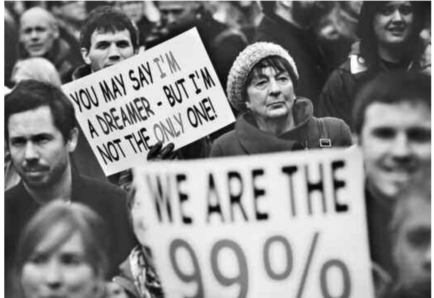
Wall Steet işgali 2011-

Bu iki anlayış da aslında ortak bir tutumdan besleniyor: kitlelerin kendi eylemine güvenmemek, işçi sınıfının eylemi yerine kendi eylemini ikame etmek veya Lenin'in sözleriyle "kitlelere kendi doktrinerliğini dayatmak". Reformistler, işçi sınıfı "adına" ve onların yerine parlamentoda çeşitli iyileştirmeler yapabileceklerini savunuyorlar, dolayısıyla işçi sınıfını kendilerine oy vermeye çağırıyor, eylemlerinin sistem sınırları dışına çıkmasına karşı çıkıyorlar. Ultra-solcular ise işçi sınıfının gün-