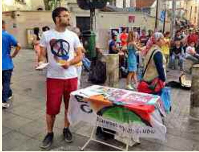
Küresel Eylem Grubu karşı iklim zirvesi sokak standı

Artık yenilenebilir enerjiye yatırım yapılmalı. Milyar dolarlar şirketleri değil, gezegeni kurtarmak için harcanmalı. Bir daha hatırlatmalı ki, “Güneş, rüzgar bize yeter”