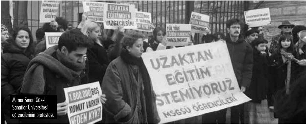
Mimar Sinan Güzel Sanatlar Üniversitesi öğrencilerinin protestosu

Deprem sebebiyle üniversitelerde uzaktan eğitime geçilmesi ve KYK yurtlarının boşaltılması tepkilerle karşılandı. Eğitim Sen uygulamaya karşı dava açarken, İstanbul, İzmir ve Ankara'da üniversite öğrencileri protestolar düzenledi. On binlerce boş konut varken, oteller boş dururken eğitime göz dikilmesi kabul edilemez. Bazı öğrencilerin dönecek bir evi kalmadı, kimileri için ise