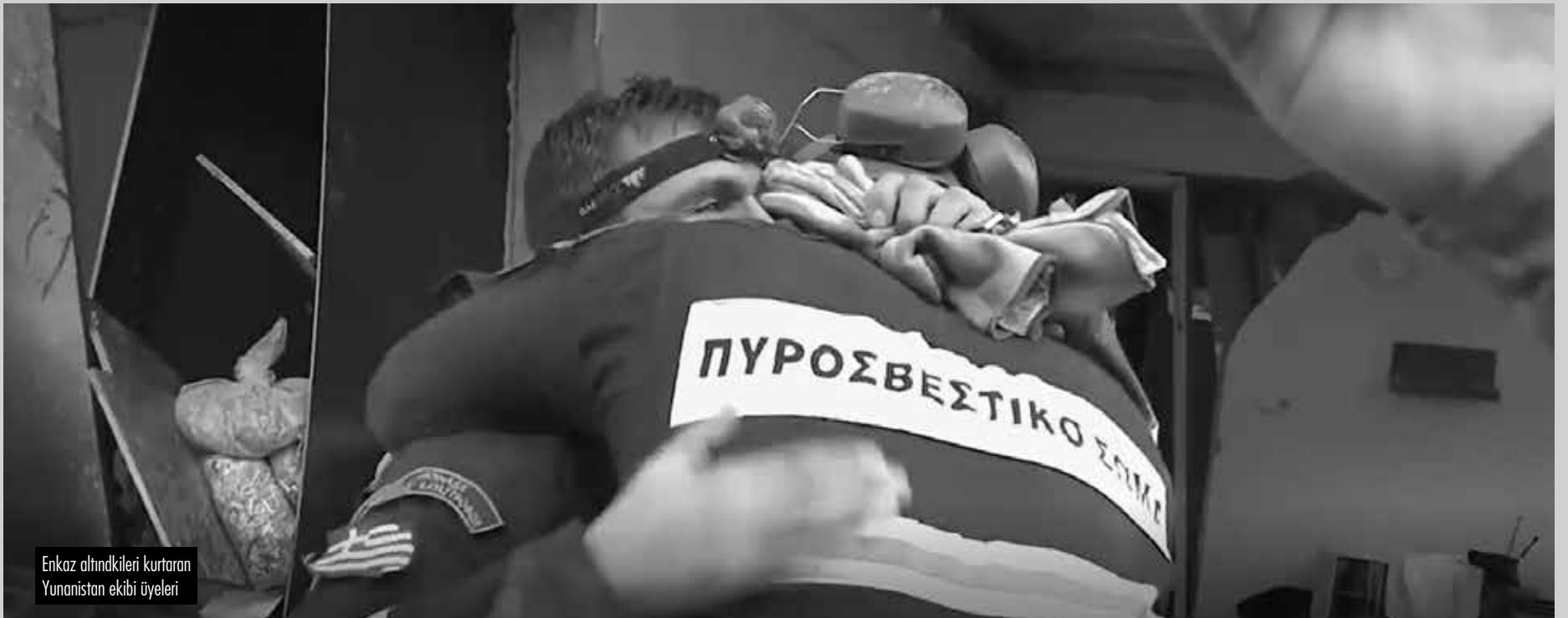
Enkaz altındaki kurtaran Yunanistan ekibi üyeleri