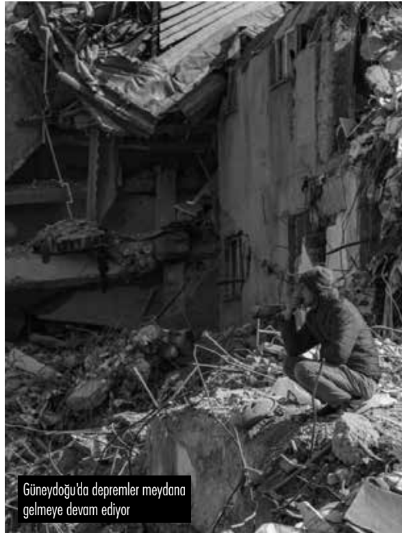
Güneydoğu'da depremler meydana gelmeye devam ediyor

Bilim insanlarının bu kadar uyarmasına rağmen deprem