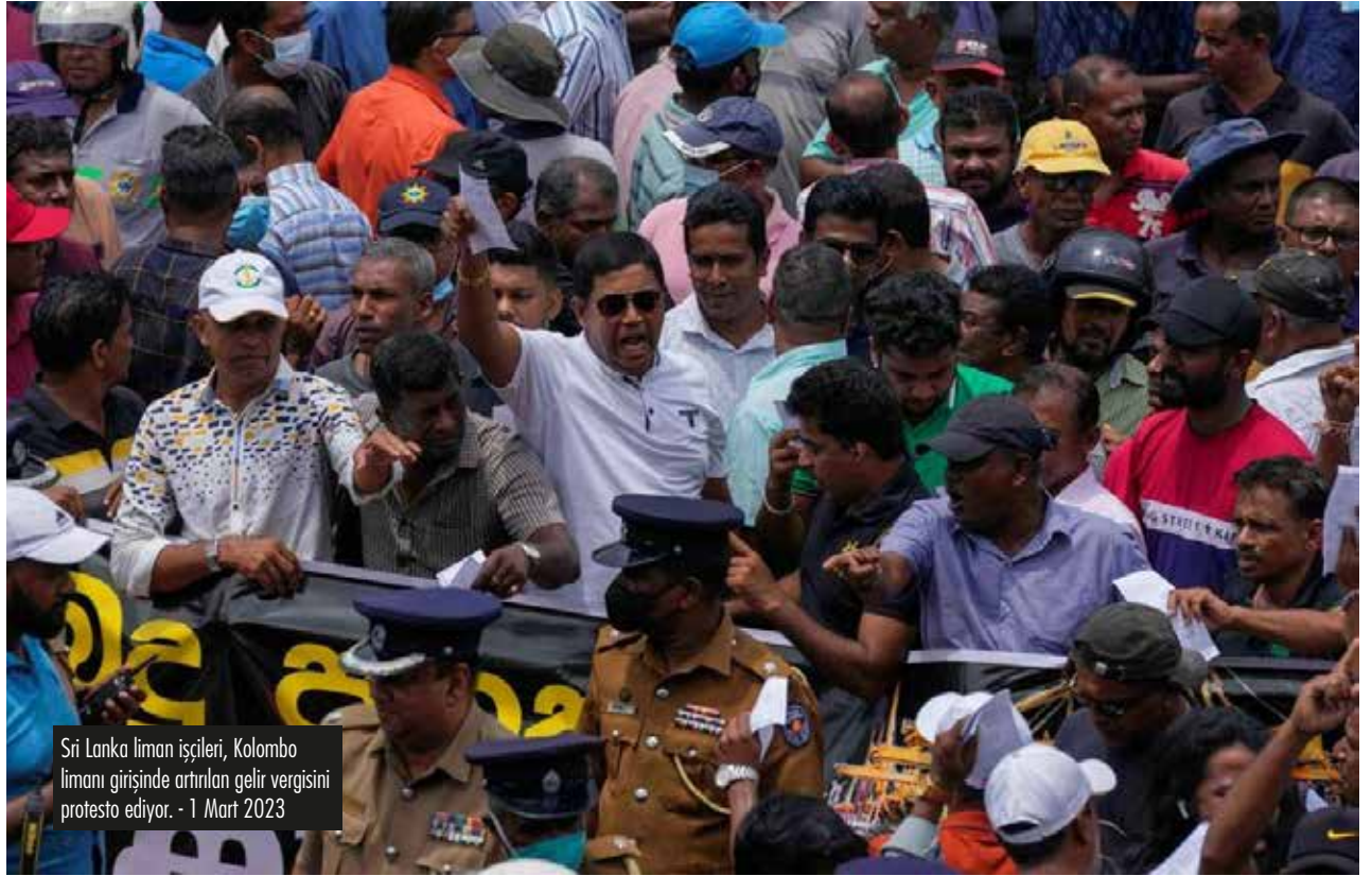
Sri Lanka liman işçileri, Kolombo limanı girişinde artırılan gelir vergisini protesto ediyor. - 1 Mart 2023