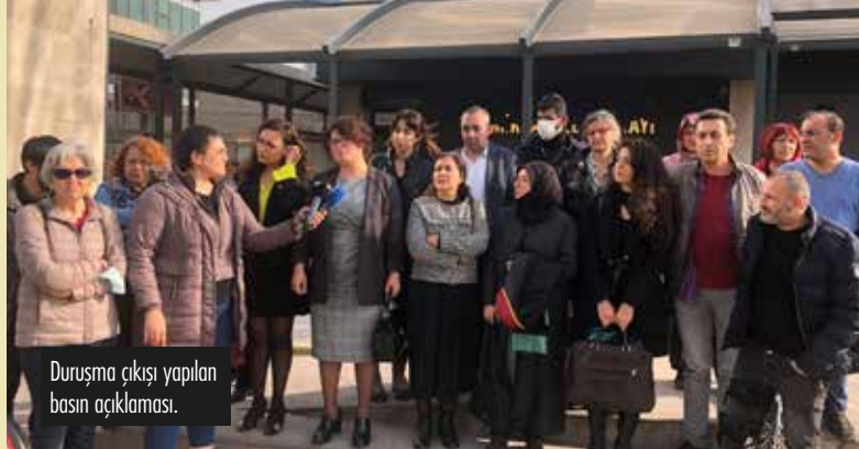
Duruşma çıkışı yapılan basın açıklaması.

Bu davayı takip etmek ilk duruşmada olduğu gibi hem çok sayıda avukatın, baro temsilcisinin hem STK ve siyasi parti temsilcilerinin (Sığınmacılar Platformu, İzmir Mülteci Dayanışma Platformu, Yaşamak Derneği, Mülteciler, İzmir Barosu