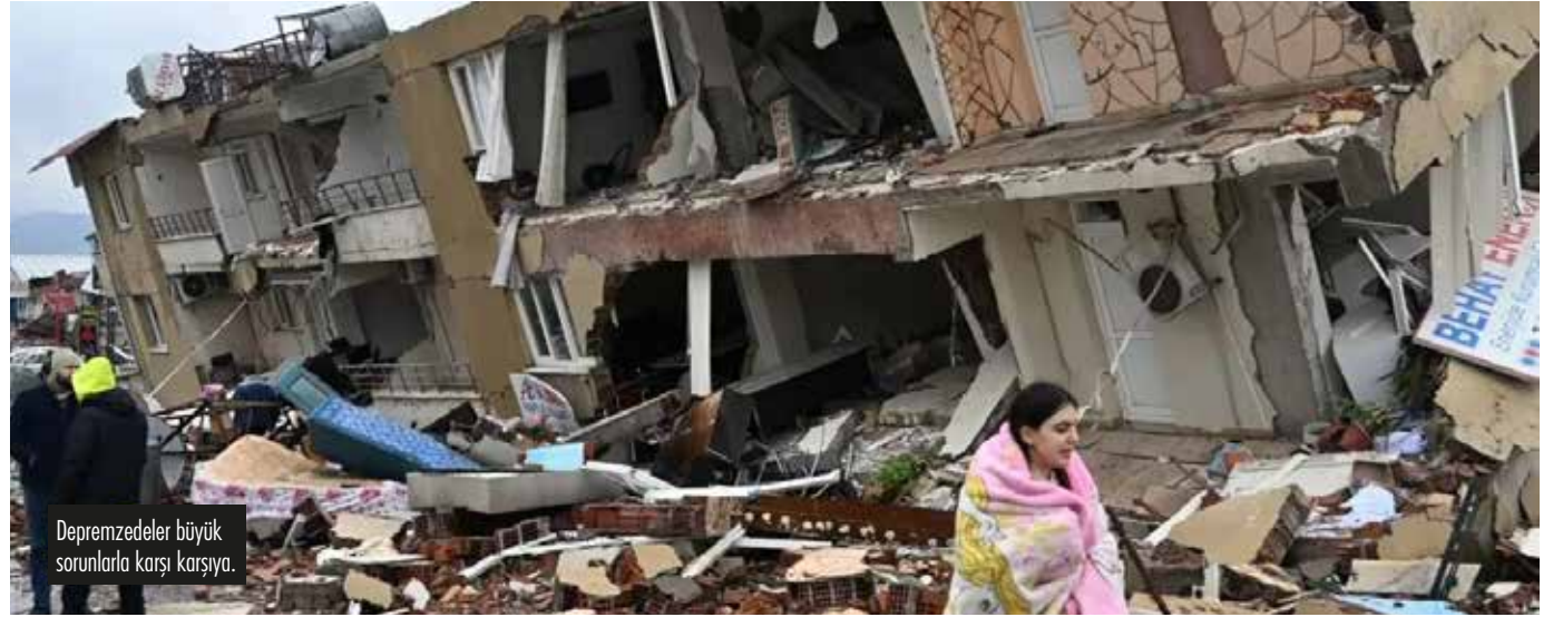
Depremzedeler büyük sorunlarla karşı karşıya.

Bilim insanlarının uyarılarına rağmen hızla devreye sokulan yeni yerleşim bi- rimlerinin inşası, büyük ihaleler ile inşaat şirketlerine veriliyor. Herkesin bir an önce, güvenli bir evde yaşaması milyon- larca kişinin talebi. Buna karşılık, bu ko- nutların yapılması iki yıl sürecek. Yani 10 ilde depremin vurduğu yüz binlerce kişi bu süre zarfında büyük sıkıntı çekecek.