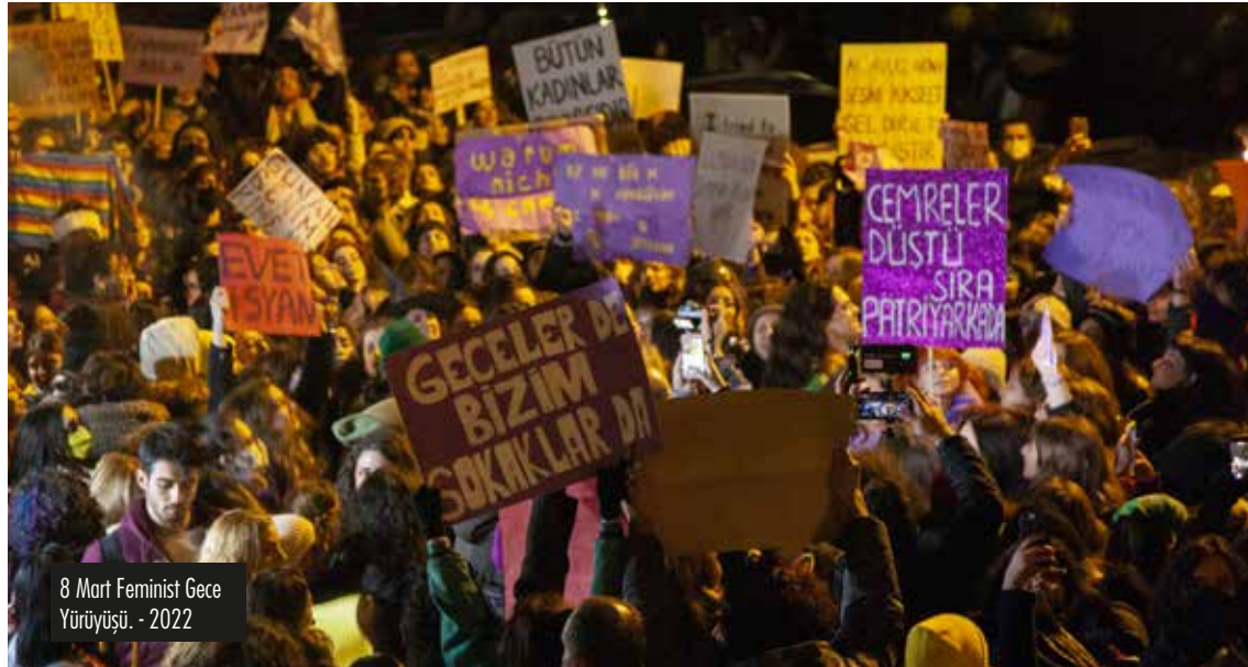
8 Mart Feminist Gece Yürüyüşü - 2022

Enkaz altında kurtarılmayı bekleyenlerin yardımına hızlıca örgütlenen gönüllüler yetişti ve kısıtlı imkanları ile yardım etmeye çalıştı. Göçlük altından bulunduğu yerin adresini mesaj atan ve kurtarılmak için yardım isteyen insanların tek seslerini duyurabilecekleri yer olan Twitter bant daraltma ile yavaşlatıldı. İlk 72 saat oldukça önemli iken, enkaz bölgelerinde büyük çoğunlukla sadece gönüllüler vardı. Ulaşılmayan pek çok köy, ilçe, bina, göçük vardı. Resmi kurumlar çok geç geldiği gibi, organizasyon eksikliği yaşadı ve bu sorun sebebiyle işleri yavaşlattı, ekipman sorunu yaşandı. Deprem alanına gitmiş gönüllü arkadaşlarımızdan duyduklarımızla ve deprem bölgesinden sosyal medyada paylaşım yapan pek çok gönüllüden ya da depremededen olayın vahametini öğrendik.