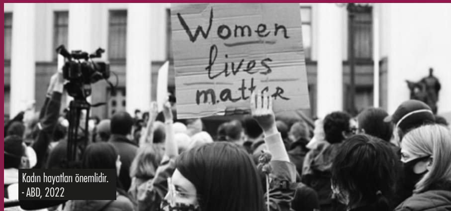
Kadın hayatları önemlidir. - ABD, 2022

Bilindiği üzere 8 Mart'ta dünyanın pek çok şehrinde kadınlar hak mücadelesi, adalet, özgürlük, eşitlik gibi talepler etrafında sokaklara çıkıyor, şiddet, taciz, istismar gibi konulara vurgu yapıyor. Bu talepler dünyanın her yerinde ortak talepler. Özellikle altının çizilmesi gereken yer, kadınlar gelişmiş ülkelerde de adaletsizliğe uğruyor, şiddete ya da cinsiyetçiliğe maruz kalıyor. Bu yüzdendir ki, dünyanın pek çok yerinde çıkan ses birbirine ilham oluyor, birbirinden besleniyor. Türkiye'de de her yıl hem 8 Mart Feminist Gece Yürüyüşlerinde, hem de 25 Kasım Kadına Yönelik Şiddete Karşı Uluslararası Mücadele Günü'nde kadın cinayetlerinde