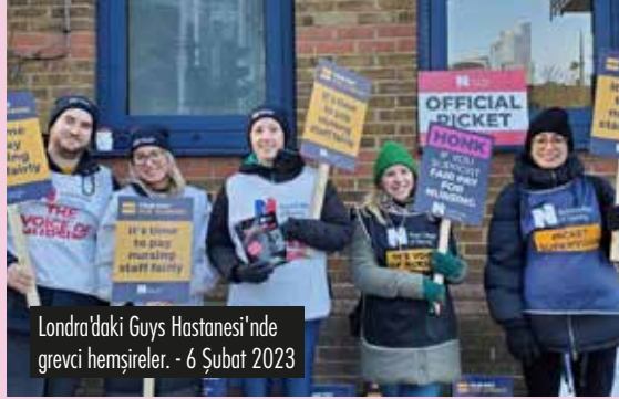
Londra'daki Guys Hastanesi'nde grevci hemşireler. - 6 Şubat 2023

Aylardır neredeyse bütün sektörlerde yoğun bir grev dalgasının yaşandığı İngiltere'de 15 Mart sınıf mücadelesinin keskinleştiği günlerden biri olacak. 500 bin işçinin greve gitmesi bekleniyor.