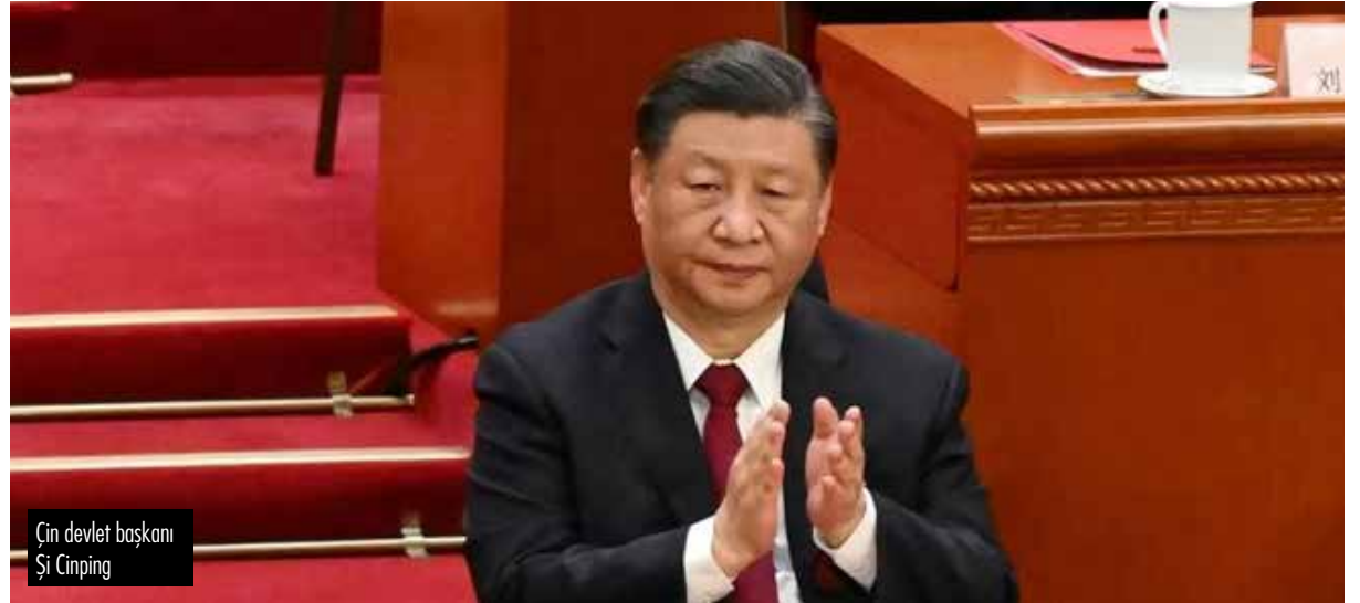
Çin devlet başkanı Şi Jinping

Brezilya'nın sosyal demokrat başbakanı Lula da Silva, geçtiğimiz hafta Çin'i ziyaret etti. ABD başkanı Joe Biden, her ne kadar geçtiğimiz Ekim ayında aşırı sağcı Jair Bolsonaro'ya karşı kazandığı zaferi memnuniyetle karşılamış olsa da Lula'nın Çin'de söylemiş olduğu sözlerden aynı ölçüde hoşlandığını düşünmek zor. Lula Şangay'da Amerikan dolarına alternatif olacak yeni başat para birimleri için çağrıda bulunuyordu: "Her gece kendime soruyorum, neden tüm ülkeler ticaretlerini dolar bazlı yapmak zorunda?"