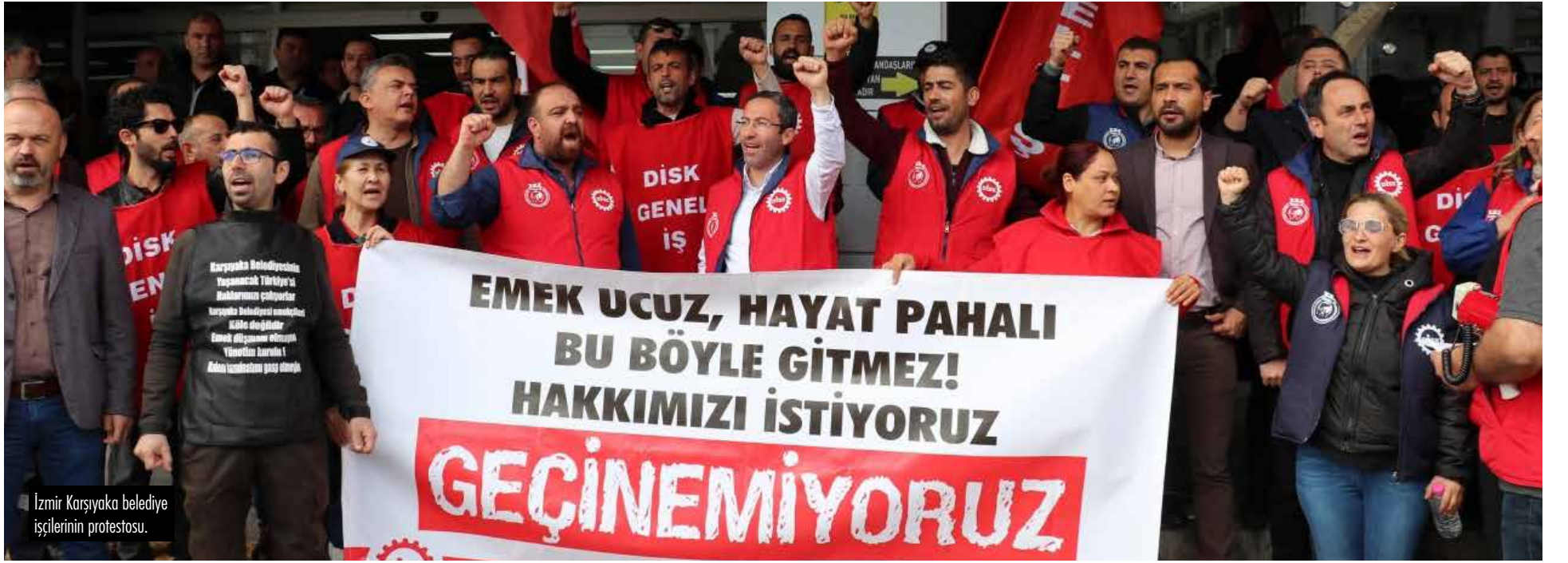
İzmir Karşıyaka belediye işçilerinin protestosu.

B u iktidardan bir an önce kurtulmak ve yaşam hakkımıza dahi göz diken nefret ittifakını yenmek istiyoruz. Ancak herkes için barışçıl, adil, eşit ve özgür bir yaşamı kurmadan mücadelemiz bitmeyecek!