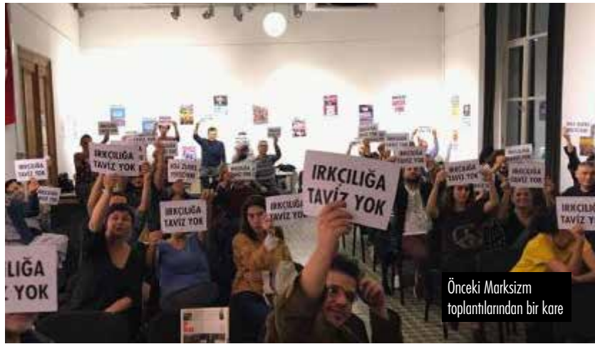
Önceki Marksizm toplantılarından bir kare

Daha önce de duyurusunu yaptığımız gibi, seçimler öncesinde, 5-7 Mayıs'ta Cezayir Toplantı Salonu'nda, hem kü-