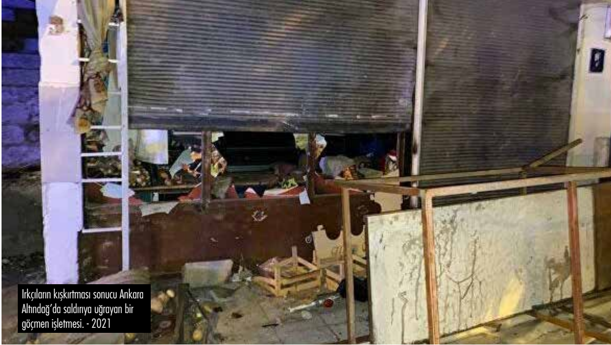
İrkçuların kışkırtması sonucu Ankara Altındağ'da saldırıya uğrayan bir göçmen işletmesi. - 2021

Seçimler yaklaştı, vaatler havada uçuşuyor. Dört cumhurbaşkanı adayından üçü başta Suriye olmak üzere çeşitli ülkelerden gelen göçmenleri göndermeyi vaat ediyor. Biri ise göçmenleri bir siyasi koz ve ucuz emek sömürsünde kullanıp, alttan alta geri göndermeye hazırlanıyor.