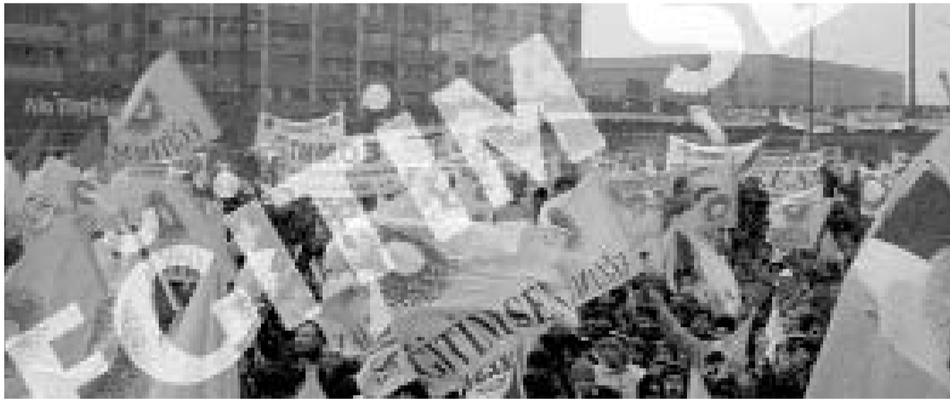
Anadilde eğitim istemek özgür: Ana dilde eğitim isteyen ve bu talebini tüzüğüne koymuş olan Eğitim Sen aleyhine açılan dava geçen hafta düştü. Mahkemenin bu kararı ile Kürtçe eğitim talep etmek artık özgür.

Kaynak: Greenpeace sitesi ( http://www.greenpeace.org/turkey_tr/ )