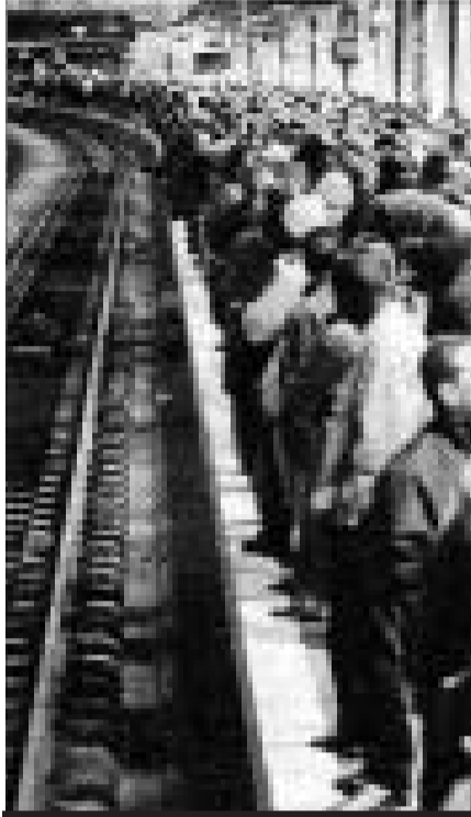
Fransa'daki grevlerin en önemlilerinden biri demiryolu işçilerinininkiydi. Tüm ülkede trenlerin dörtte üçü çalışmadı. Ulaşım felç oldu.

Bu iki grev kamu sektörünün diğer kollarında çalışan hizmet sektörü işçilerine de esin kaynağı oldu. Ertesi gün bazılarında yüzbinlerin katıldığı çok sayıda gösteri yapıldı. Anketler özel sektörde çalışan işçilerin büyük çoğunluğunun da grevleri desteklediğini gösteriyor. Üstelik hükümetin kamu ve özel sektör işçileri arasında set çekmeye çalışmasına rağmen. Şimdi soru şu: Bundan sonraki adımımız ne? Cumartesi günü (5 Şubat'ta) sendikalar 35 saatlik çalışma haftasının uzatılması girişimine karşı bir gösteri yapacak. Bu gösteri patron-