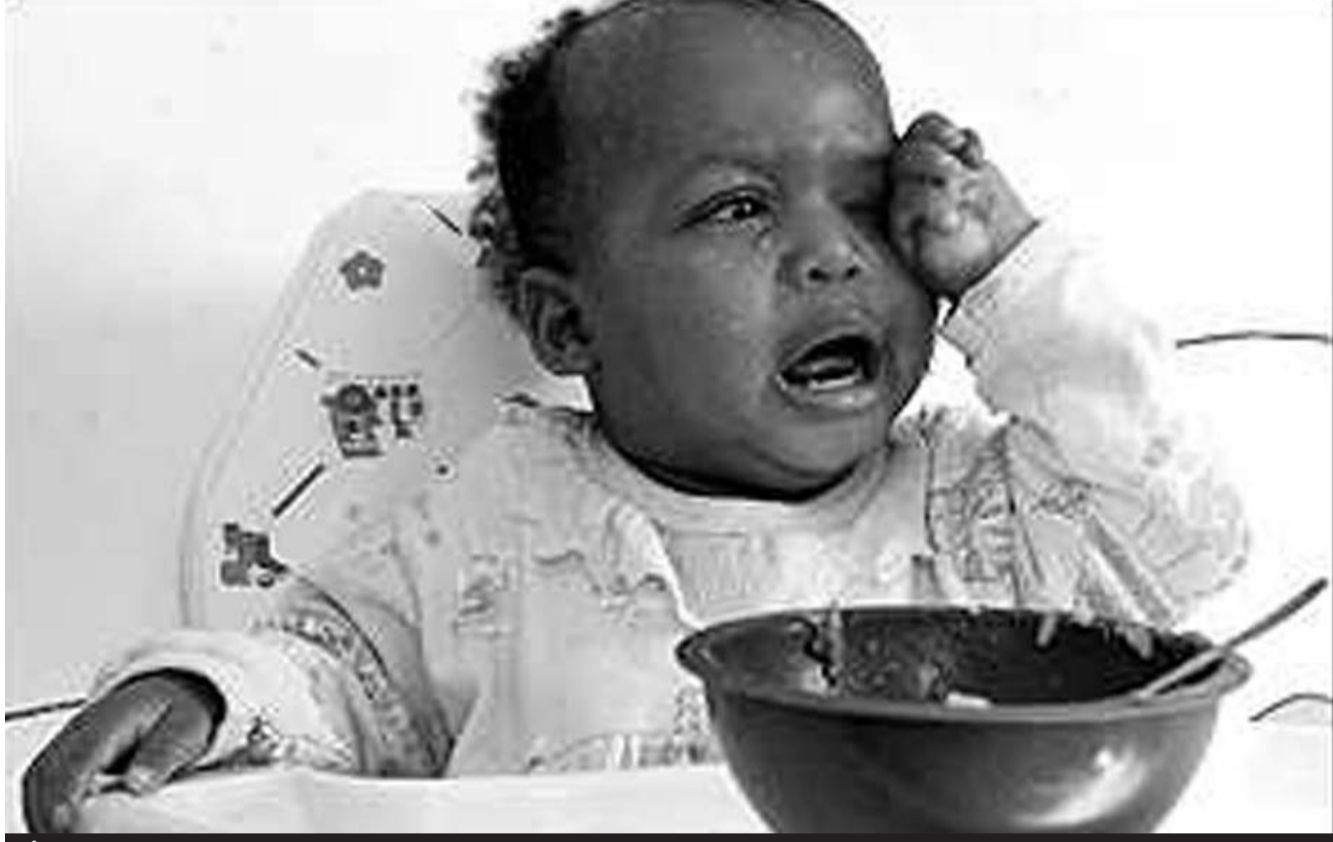
İklim değişikliği önce bütün dünyada yoksulları vuracak

Net Fotosentez Ürünü yemek, yakıt, orman kesme, aşırı avlanma türünde dünyadaki tahribatı ölçen bir ölçek. Net Fotosentez Ürünü'nden alınan pay 25 senede ikiye katlanacak. Eğer bu gerçekleşirse -1986 yılında