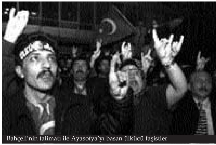
Bahçeli'nin talimatı ile Ayasofya'yı basan ülkücü faşistler

hertürlü yazışma için: sosyalistisci@gmail.com