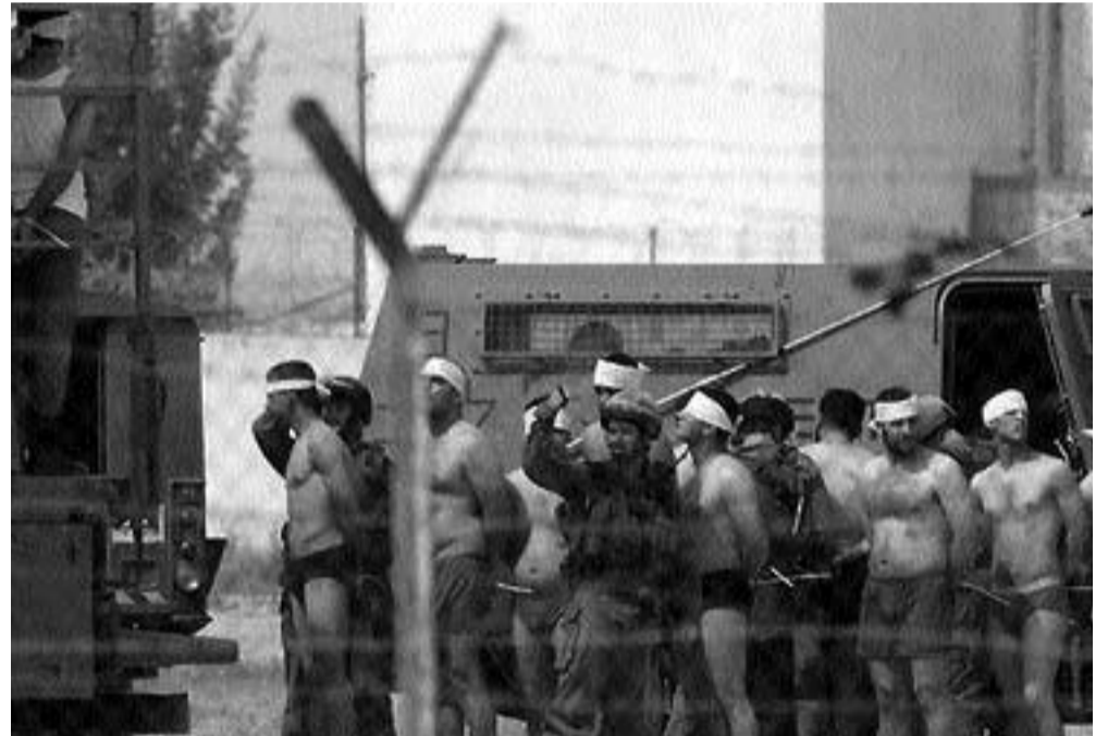
ABD gerek Afganistan'da gerekse de Irak'da muazzam bir vahşet uyguluyor. Ölü sayısı Irak'da 650 bin kişiye ulaştı. Buna rağmen direnişi kıramıyor. Buna rağmen işgal güçleri burunlarını barakalarından çıkaramıyorlar.

olması nedeniyle loday ve ucuza çıkarılıyor olması.