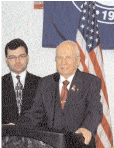
Bu adam yargılansın

Bu anayasanın Türkiye'yi nasıl bir siyasal siyasal krize soktuğuna 2007 yılı boyunca tanık olduk. Seçimler sürecinde yükselen darbe tehditleri kendini 12 Eylül