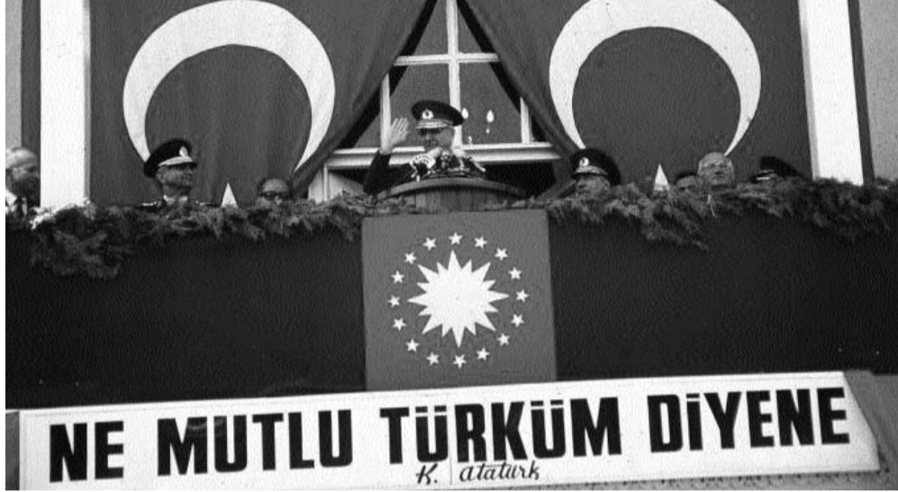
Her anayasa 12 Eylül Anayasasından daha iyidir. Ya 12 Eylül'den yanasın ya da karşısın

TÜSİAD Başkanı Arzuhan Doğan Yalçındağ da yeni Anayasa taslağına muhalif. AKP'yi merkez sağ bir hatta oturmamakla