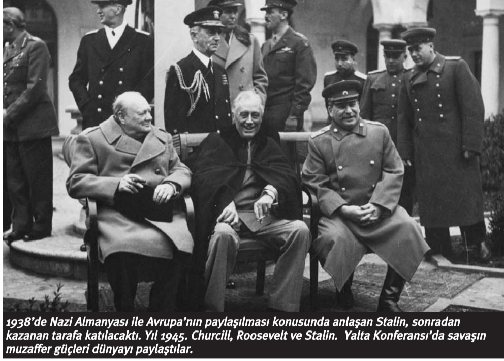
1938'de Nazi Almanyası ile Avrupa'nın paylaşılması konusunda anlaşan Stalin, sonradan kazanan tarafa katılacaktı. Yıl 1945. Churchill, Roosevelt ve Stalin. Yalta Konferansı'nda savaşın muzaffer güçleri dünyayı paylaştılar.

TKP bu geleneği günümüzde de sürdürmekte. Ancak "yurtseverlik" bayrağına sarıl-